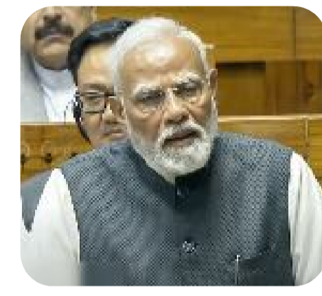
ప్రభుత్వ లక్ష్యమని, ఈ క్రమంలో మధ్య తరగతి ప్రజల ఆకాంక్షలను నెరవేర్చాలి ఉందని మోదీ అభిప్రాయపడ్డారు. ఈ సందర్భంగా గత యూపీఏ పాలనపై విమర్శనాస్థిలు సంభించారు. "గత ప్రభుత్వాల గరిజే హఠాత్ అంటూ నినాదాలు మాత్రమే ఇచ్చాయి. మేం గత పదేళ్ల కాలంలో 25 కోట్ల మందిని పేదరికం నుంచి బయటికి తీసుకువచ్చాం. కొందరు నేతలు బంగ్లాలు కట్టుకోవడంపై దృష్టి సారించారు. మేం ప్రతి ఇంటికి మంచి గిరు అందించడంపై దృష్టి సారించాం. దేశంలో పేదల కోసం 12 కోట్లకు పైగా మరుగుదొడ్లు కట్టించాం. కొందరు నేతలు కేవలం పేదలతో పోటీలు దిగేందుకే ఉత్సాహం చూపిస్తుంటారు..."

గొడుగు కిందకు తెచ్చి పీ4 విధానం అమలు చేస్తామని చెప్పారు. ఇదే సమయంలో ప్రత్యేక సర్వే ద్వారా అట్టడుగున ఉన్న వర్గాలను గుర్తించి...వారికి సాయం అందేలా చేస్తామన్నారు. దీనికోసం అవసరమైన డేటాను సేకరించాలని ముఖ్యమంత్రి అధికారులను ఆదేశించారు. ఇప్పటికే పలువురు పాలితామిక వేతనలు తమ సొంత ఊళ్ళు, మండలాలను అభివృద్ధి చేసేందుకు ముందుకు వచ్చారని...అలా ఆసక్తి ఉన్న వారిని స్వయంగా ఆహ్వానించి...ఉగాది రోజున పీ4 కార్యక్రమాన్ని ఆవిష్కరిస్తామన్నారు. పబ్లిక్-ప్రైవేట్-పీపుల్స్-పార్టనర్షిప్ విధానం అమలు ద్వారా పేదరిక నిర్మూలన అడుగులు వేస్తామని సీఎం చంద్రబాబు అన్నారు. ఈ సమీక్షలో రాష్ట్ర ప్రభుత్వ ప్రధాన కార్యదర్శి కె.విజయానంద్, అర్ధికశాఖ మంత్రి పర్యూవుల కేశవ్, ప్లానింగ్ శాఖ అధికారులు పాల్గొన్నారు.