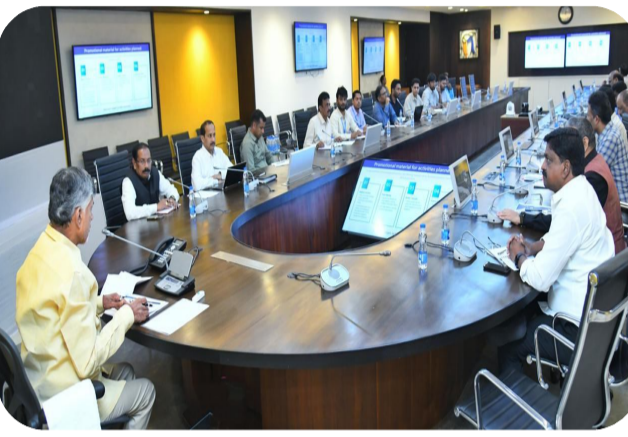
పీ4 కార్యక్రమం ప్రారంభంపై అధికారులతో చర్చించారు. పాలితామిక వేతనలు, ఎన్ఆర్ఐలతో పాటు కొంత ఉన్నత స్థాయిలో ఉన్నవారు పేదరిక సాయం చేసేందుకు ముందుకొస్తున్నారని...వీరందరినీ ఒక

అమరావతి: పేదరిక నిర్మూలనకు రాష్ట్ర ప్రభుత్వం ప్రతిపాదించిన పీ4 విధానాన్ని ఉగాది పండుగ నుంచి ప్రారంభించనున్నట్లు ముఖ్యమంత్రి నారా చంద్రబాబు నాయుడు తెలిపారు. పీ4 విధానం ద్వారా సమాజంలో అర్ధకంగా అర్జన్యంలో ఉన్న 10 శాతం మంది...అట్టడుగున ఉన్న 20 శాతం మందికి చేయూ తనివ్వడం ద్వారా మంచి ఫలితాలు సాధించవచ్చని సీఎం అన్నారు. దీనిపై సమగ్ర విధి విధానాలను రూపొందించేందుకు ప్రజల నుంచి సలహాలు, సూచనలు, అభిప్రాయాలను తీసుకునేందుకు ప్రత్యేకంగా పోర్టల్ ను తీసుకురావాలని అధికారులను సీఎం ఆదేశించారు. పేదరిక నిర్మూలన విషయంలో ప్రజల అభిప్రాయాలు, ఆలోచనలను తీసుకుని పీ4 విధానాన్ని అమలు చేయనున్నట్లు సీఎం తెలిపారు. సచివాలయంలో ప్లానింగ్ శాఖపై సమీక్ష సందర్భంగా