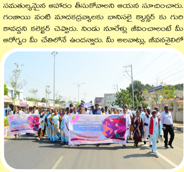
సమతుల్యమైన ఆహారం తీసుకోవాలని ఆయన సూచించారు. గంజాయి వంటి మాదకద్రవ్యాలకు బానిసలై క్యాన్సర్ కు గురి కావద్దని కలెక్టర్ చెప్పారు. నిండు సూర్యోజ్వలం జీవించాలంటే మీ ఆరోగ్యం మీ చేతిలోనే ఉండాలి. మీ అలవాట్లు, జీవనశైలిలో