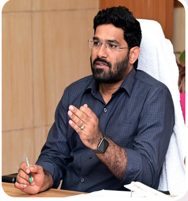
చేయుట, పూర్తిగా రద్దు చేయుటకు జిల్లా యంత్రాంగానికి అధికారాలు ఉన్నాయని ఆ ప్రకటనలో జిల్లా జాయింట్ కలెక్టర్ తెలిపారు.

తేదీ ఉదయం 11.00 గంటలకు ఉండి ఎం ఎల్ ఎస్ పాయింట్ వద్ద బహిరంగ వేలం నిర్వహించడం జరుగుతుందని తెలిపారు. ఆసక్తి కలిగిన వ్యాపారస్తులు జిఎస్టీ లైసెన్స్ కలిగి ముందుగా రూ.5,000/- ధరావత్తు సామ్మూను చెల్లించాల్సి ఉంటుందన్నారు. వేలంలో హెచ్చు పొటదారునికి సరుకును అప్పగించడం జరుగుతు ఉంటుంది. వేలం పాట వాయిదా వేయటం, నిలుపుదల