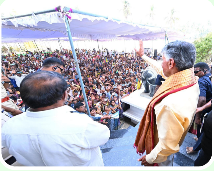
ఇచ్చటకు చర్చలు తీసుకుంటూ మన్నారు. గీత కులాల వారికి మద్దం షాపుల్లో 10 శాతం కేటాయిం చామని, లిజిస్ట్రేషన్ స్థిబిలో 50 శాతం సబ్సిడీ అంది