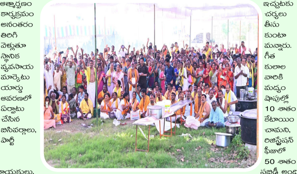
నాయకులు, కార్యక్రమం అనంతరం తిరిగి వెళ్ళుతూ స్థానిక వ్యవసాయ మార్కెటు యార్డు ఆవరణలో ఏర్పాటు చేసిన బసినెట్లూ, పాల్టీ