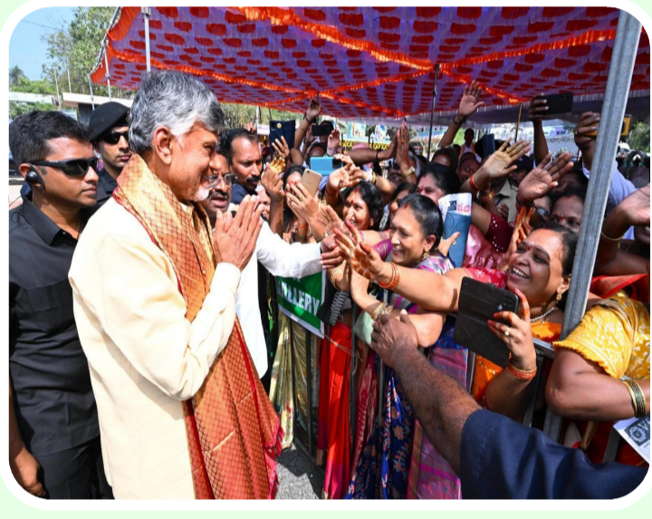
పెనుగొండజనవరి 31 శుక్రవారం పెనుగొండ మండలం పెనుగొండ శ్రీ వాసవి కన్యకాపర మేళవల