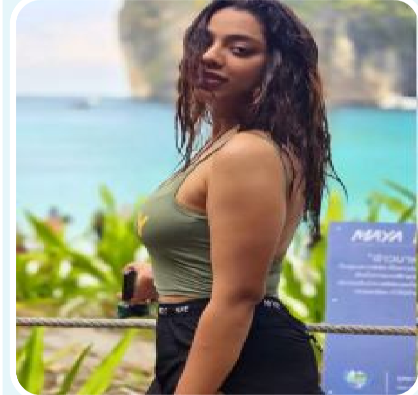
అభిప్రాయంను కొందించు వ్యక్తం చేస్తున్నారు. నటిగా మంచి పేరును తెచ్చుకున్న ఈ అమ్మడు ముందు ముందు యంగ్ స్టార్ హీరోల దృష్టిని ఆకర్షించుకుంటుందేమో చూడాలి.