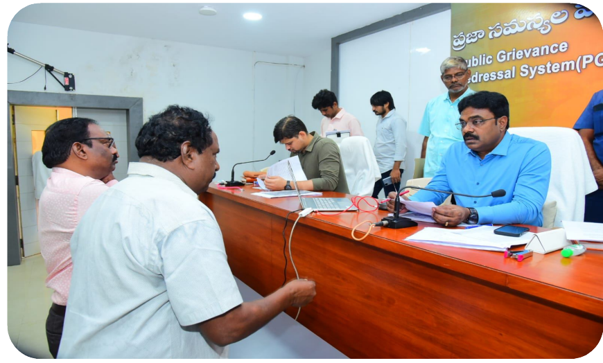
రాయల్ జర్నలిజం (బాపట్ల) జనవరి 06 : జిల్లాలో ప్రజా సమస్యల పరిష్కార వేదికలో ప్రజల నుండి వచ్చే అర్జీల పరిష్కారం పై ప్రత్యేక శ్రద్ధ పెట్టాలని జిల్లా కలెక్టర్ జె. వెంకట మురళి అధికారులను ఆదేశించారు. సోమవారం స్థానిక కలెక్టరేట్ లో ప్రజా సమస్యల