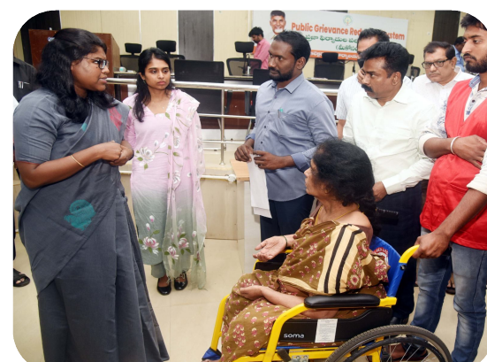
ఏలూరు పిజిఆర్ఎస్ ప్రజా ఫిర్యాదుల పరిష్కార వ్యవస్థ) ద్వారా అందిన అర్జీలను నిర్ణీత గడువులోగా పరిష్కరించాలని జిల్లా కలెక్టర్ కె. వెల్లిసెల్వీ అధికారులను ఆదేశించారు. సోమవారం కలెక్టరేట్ కార్యాలయం గోదావరి సమావేశ మందిరంలో జరిగిన జిల్లాస్థాయి పిజిఆర్ఎస్ కార్యక్రమంలో జిల్లా కలెక్టర్ వెల్లిసెల్వీ, జాయింట్ కలెక్టర్ పి. ధాత్రిరెడ్డి, డి.ఆర్.వి. వి.శ్యావేంద్రరావు, అర్జీతో అచ్చత అంబరీష్, సైఫల్ డిస్పూటీ కలెక్టర్ కె. భాస్కర్ లతో కలిసి అర్జీలు స్వీకరించారు. జిల్లాలో ఆయా ప్రాంతాల నుంచి వచ్చిన ప్రజల నుంచి అందిన అర్జీలను ఆయా శాఖల అధికారులు త్వరితగతిన పరిష్కరించి

అర్జీలను నిర్ణీత గడువులోగా పరిష్కరించాలి: జిల్లా కలెక్టర్ కె. వెల్లిసెల్వీ