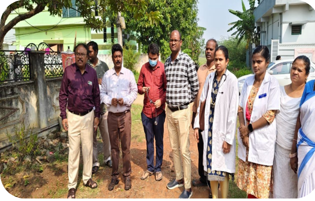
ఫించిన దారుల ఇళ్లకు స్వయంగా వెళ్ల వారి పర్యవేక్షించారు.

దెందులూరు, (వి.శ్యా విశేష- ప్రత్యేక ప్రతినిధి): జిల్లాలో ఎన్.టి.ఆర్ భరోసా దివ్యాంగుల సదరం సర్టిఫికేషన్ పరిశీలనలో భాగంగా, రాష్ట్ర ప్రభుత్వం ఆదేశాల మేరకు సోమవారం సదరం సర్టిఫికేట్ పరిశీలన కార్యక్రమం ప్రారంభించడం జరిగింది. ఈ కార్యక్రమం నందు ప్రభుత్వం పరిశీలనకు కేటాయించిన గుంటూరు, విజయవాడ, ఒంగోలు నుండి ప్రభుత్వ డాక్టర్ లు పరిశీలన ప్రక్రియను ప్రారంభించడం జరిగింది. ఈ కార్యక్రమం లో భాగంగా జిల్లాలోని దెందులూరు మండలంలో 60 మంది