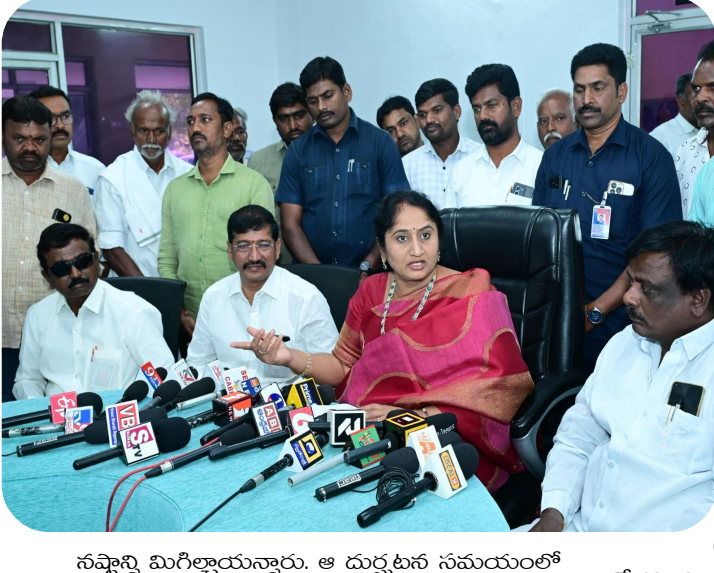
నష్టాన్ని మిగిల్చారున్నారు. ఆ దుర్ఘటన సమయంలో బాధితులను జగన్ పరామర్శించలేదని, బాధిత కుటుంబాలను పట్టించుకోలేదని మండిపడ్డారు. దెయ్యాల వేదాలు వల్లించినట్లు తిరుపతి ఘటనపై జగన్ మాట్లాడడం విడూరంగా ఉందన్నారు. బాబాయ్ కి గొడ్డలి పోటు, తోడికత్తి, గులకరాయి ఘటనలతో రాజకీయాలు జగన్ అలవాటైందన్నారు. సీఎం చంద్రబాబు గురించి మాట్లాడే అర్హత జగన్ కు లేదని మంత్రి స్పష్టం చేశారు. గడిచిన అయిదేళ్లలో ఎన్నో సాంసాత్తక ఘటనలు రాష్ట్రంలో

రూ.25 లక్షల చొప్పున నిష్పలపారంతో పాటు కుటుంబంలోకి ఒకరికి కాంట్రాక్టు ఉద్యోగం కూడా ఇవ్వనున్నామన్నారు. తీవ్రంగా గాయపడిన క్షతగాతులకు రూ.5 లక్షలు, స్వల్పగాయాలైన వారికి రూ.2 లక్షలు అందించడంతో పాటు మొత్తం వైద్యం ప్రభుత్వమే భరిస్తుందని మంత్రి తెలిపారు. ప్రజల్లో కష్టాల్లో ఉన్నప్పుడు వారి వెంట ఉంటూ, అన్ని విధాలా అండగా నిలుస్తూ, సీఎం చంద్రబాబునాయుడు భరోసా ఇస్తుంటారన్నారు. విజయవాడలో కృష్ణానదికి వరదలు వచ్చిన సమయంలో బాధితులు కోలుకునే వరకు అక్కడి కలెక్టర్ కార్యాలయంలో ఓ బస్సులో పది రోజులపైగా సీఎం చంద్రబాబు బస్ చేసిన విషయాన్ని మంత్రి గుర్తు చేశారు.