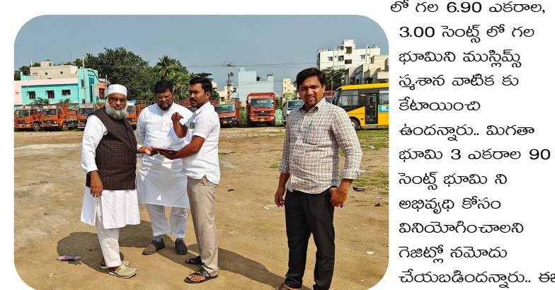
విషయంలో తన నిర్ణయాన్ని తీసుకోవడమే కాకుండా చేపడతామని తెలిపారు.