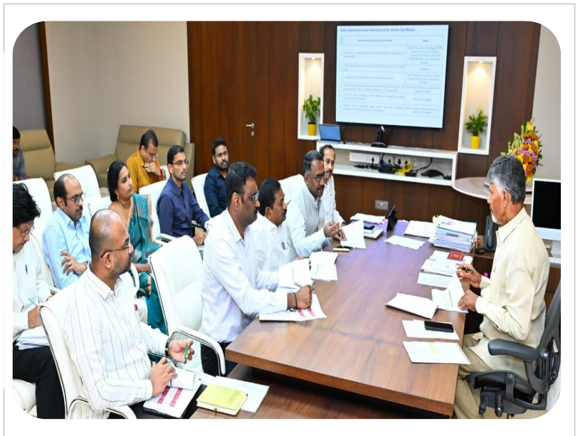
గ్రామ, వార్డు సచివాలయ వ్యవస్థపై సచివాలయంలో సీఎం చంద్రబాబు నాయుడు సమీక్ష చేపట్టారు. కీలక ఈ సమీక్షకు మంత్రి డోలా బాల వీరాంజనేయ స్వామి, ఉన్నతాధికారులు హాజరయ్యారు.

ప్రతి శాఖలో సమన్వయం చేసుకోండి: ప్రభుత్వంలోని ప్రతి శాఖతోనూ ఆర్టిజిఎస్ సమన్వయం చేసుకోవాలని సీఎన్ విజయానంద్ సూచించారు. ఆర్టిజిఎస్ వద్ద ఉన్న ఇన్ఫోవేషన్ టెక్నాలజీలను ఆయా శాఖలకు పంపి, వారి ఆర్టిజిఎస్ నుంచి ఇంకా ఏం కావాలని కోరుకుంటున్నారో వారితో నేరుగా చర్చించి, ఆయా శాఖల అవసరాలకు అనుగుణంగా సాధ్యమైనంతమేర సాంకేతిక సహకారం అందివ్వాలని సూచించారు. ప్రభుత్వ శాఖలో లోపాలను ఎత్తి చూపడం కాకుండా, వాటి పనితీరు మరింత మెరుగుపరచడానికి ఆర్టిజిఎస్ దోహదపడేలా తన సాంకేతిక సదుపాయాలను అందించాలన్నారు. ఆర్టిజిఎస్ నుంచి ప్రతి శాఖకు ఒక ప్రతినిధిని పంపి, అక్కడి శాఖాధిపతి, అధికారులతో చర్చించి పౌరులకు అందిస్తున్న సేవలకు సంబంధించి ఆ శాఖ ఎదుర్కొంటున్న సమస్యలను తెలుసుకుని వాటికి సాంకేతిక పరిష్కారాలు కనుగొని ఆయా శాఖల పనితీరు మెరుగుపరచడానికి దోహదపడాలన్నారు. ఈ సమావేశంలో ఆర్టిజిఎస్ డిప్యూటీ సీఈఓ ఎం. మాధుల, అధికారులు పాల్గొన్నారు.