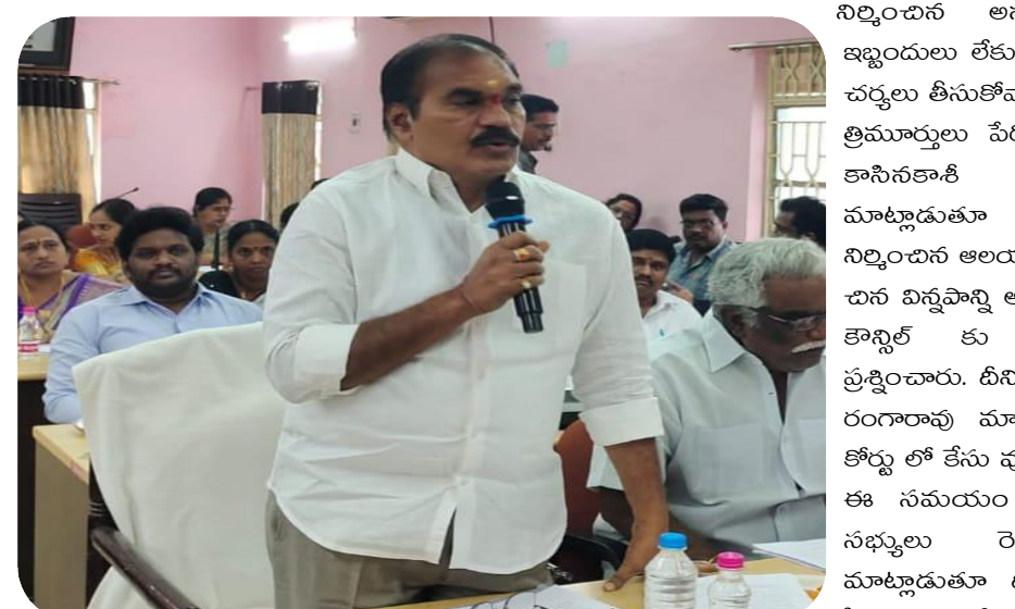
మండపేట:మండపేట బూరుగుంట చెర్రు వద్ద గతంలో ఉపసంహరించే నిర్మాణాధారాలు పరిశీలించాలని విజ్ఞప్తి