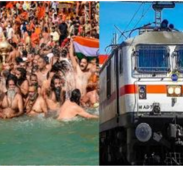
17,24,25 తేదీల్లో నడపనున్నాయి. ఈ రైలు సాయంత్రం 5.30 గంటలకు బయల్దేరి మరుసటి రోజు ఉదయం 5.30 గంటలకు విజయవాడ చేరుతుంది. అదే విధంగా నర్సాపూర్

అమరావతి : మహాకుంభ మేళాకు కోట్లాది మంది భక్తులు తరలి రానున్నారు. ఇప్పటికే ఇందుకు అనుగుణంగా భారీ ఏర్పాట్లు జరుగుతున్నాయి. తెలుగు రాష్ట్రాల నుంచి మహా కుంభమేళా కు వెళ్లే భక్తుల కోసం దక్షిణ మధ్య రైల్వే ప్రత్యేక రైళ్లను ప్రకటించింది. ఈ రైళ్లను జనవరి 18 నుంచి ఫిబ్రవరి 25 వ తేదీ మధ్యలో నడపనున్నారు. ఏపీలోని పలు స్థానాల మీదుగా వెళ్లే రైళ్ల షెడ్యూల్ ను అధికారులు వెల్లడించారు.తిరుపతి నుంచి బనారస్ వరకు నాలుగు ప్రత్యేక రైళ్లను అధికారులు ప్రకటించారు. జనవరి 18, ఫిబ్రవరి 2, 15, 22, 25 తేదీల్లో ఈ రైళ్ల రాకపోకలు ఉండనున్నాయి. ఈ ప్రత్యేక రైళ్లు నెల్లూరు, ఒంగోలు, తెనాలి, విజయవాడ, ఏలూరు, తాడేపల్లిగూడెం, నిడువవోలు, రాజమండ్రి, సామర్లకోట, అన్నవరం, ఎలమంచలి, అనకాపల్లి, రాయగడ, మునిగడ మీదుగా బనారస్ చేరుకోనుంది. అదే విధంగా బనారస్ - విజయవాడ మధ్య రైళ్లను అధికారులు ఖారూ చేసారు.బనారస్ - విజయవాడ మధ్య నడిచే నాలుగు ప్రత్యేక రైళ్లు జనవరి 20, ఫిబ్రవరి 2,