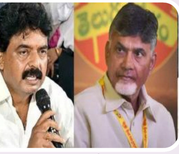
ఉన్నారుని తాము ఎప్పటి నుంచో చెబుతున్నాము, అయినా చంద్రబాబు పట్టించుకోవడం లేదని గగ్గోలు పెడుతున్నారు. దీంతో ఇప్పుడు పేర్లు చంద్రబాబును పొగడించుకుంటున్నారని మెచ్చుకోకుండా సీఎంపీలో కోపం పెరుతో సాంత ప్రభుత్వాన్ని వీరు టార్గెట్ చేయడమేంట్లు చర్చ జరుగుతోంది.