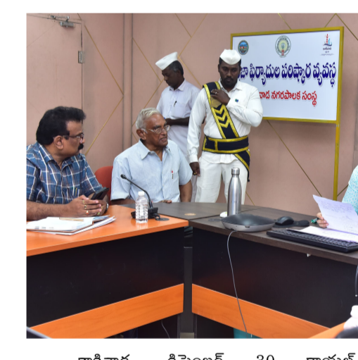
కాకినాడ, డిసెంబర్ 30 రాయల్ కమిషనర్ సంబర్క కమిషనర్ ఫోన్ చేసి తమ సమస్యలను

జర్నలిజం రాయల్ కమిషనర్, ప్రజా ఫిర్యాదుల పరిష్కార వ్యవస్థకు వచ్చే సమస్యల అర్జీల పరిష్కారానికి సత్వరం చొరవ చూపాలని కాకినాడ నగరపాలక సంస్థ కమిషనర్ భావన ఐవిఎన్ నగరపాలక అధికారులను ఆదేశించారు. సోమవారం కాకినాడ నగరపాలక సంస్థ కార్యాలయంలో ఉదయం 9.30 నుంచి 10.30 గంటల వరకు నిర్వహించిన డయల్ యువర్ కమిషనర్ కార్యక్రమానికి కమిషనర్ భావన హాజరయ్యారు. ఈ సందర్భంగా సుమారు 8 మంది డయల్ యువర్ కమిషనర్ ఫోన్ చేసి తమ సమస్యలను