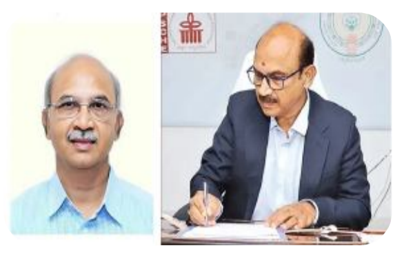
పోస్టులకు మొత్తం 24,268 మంది అభ్యర్థులు దరఖాస్తు చేసుకోగా.. 20,600 మంది పరీక్ష రాశారు. త్వరలోనే ఫలితాలు విడుదల చేయనున్నట్లు ఎంపీహెచ్ఐఎఆర్బి పేర్కొంది.