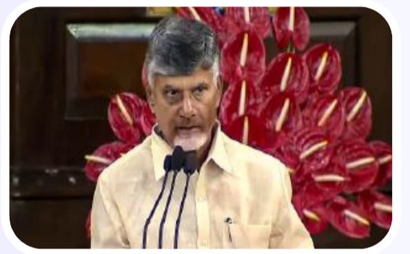
తెలిసింది.చీఫ్ మినిస్టర్ ఫెలోస్ పేరుతో ఓ కొత్త కార్యక్రమానికి సీఎం నారా చంద్రబాబు నాయుడు శ్రీకారం చుట్టనున్నట్లు తెలిసింది. ముఖ్యమంత్రి కార్యాలయానికి అనుబంధంగా ఈ చీఫ్ మినిస్టర్ ఫెలోస్ బృందం పనిచేయనున్నట్లు సమాచారం. చీఫ్ మినిస్టర్ ఫెలోస్ టీమ్ లోకి యువతను తీసుకోనున్నారు. దేశవ్యాప్తంగా ఉన్న ప్రతిష్ఠాత్మక సంస్థలో చదువుకున్న పాఠిక మంది ప్రతిభావంతులైన యువతను ఈ చీఫ్ మినిస్టర్ ఫెలోస్ టీమ్ లోకి తీసుకోనున్నట్లు తెలిసింది. వీరికి మంచి జీతాలు కూడా ఇవ్వనున్నారు. వివిధ అంశాలపై రీకెస్ ఇచ్చిన తర్వాత వీరికి జిల్లాల బాధ్యతలు అప్పగిస్తారు. అన్ని అనుకున్నట్లు జరిగితే ఏప్రిల్ నుంచి ఈ చీఫ్ మినిస్టర్ ఫెలోస్ కార్యక్రమం దాఖలున్నట్లు సమాచారం.చీఫ్ మినిస్టర్

అమరావతి : ఆంధ్రప్రదేశ్ ముఖ్యమంత్రి నారా చంద్రబాబు నాయుడు మరో కీలక నిర్ణయం తీసుకున్నట్లు తెలిసింది. ముఖ్యమంత్రి కార్యాలయానికి అనుబంధంగా చీఫ్ మినిస్టర్ ఫెలోస్ పేరుతో ఓ బృందాన్ని ఏర్పాటు చేయాలని ఆలోచిస్తున్నట్లు సమాచారం. ఉన్నత విద్యావేత్తలను యువకులను ఈ చీఫ్ మినిస్టర్ ఫెలోస్ టీమ్ లోకి చేర్చుకోవాలని భావిస్తున్నట్లు తెలిసింది. ఈ టీమ్ ద్వారా ప్రభుత్వ సంక్షేమ పథకాల అమలులో జరిగే తప్పిదాలు, ప్రభుత్వ పాలన, ప్రజల్లో స్పందన, క్షేత్రస్థాయి సమాచారం వంటి అంశాలను సేకరించాలని భావిస్తున్నట్లు సమాచారం.ఏపీ ముఖ్యమంత్రి టీడీపీ అధినేత నారా చంద్రబాబు నాయుడు గురించి ప్రత్యేకంగా చెప్పాల్సిన పనిలేదు. తెలుగు రాజకీయాల్లో ఓ పుస్తకం రాస్తే.. అందులోని ప్రతి పేజీలో కనిపించే పేరు చంద్రబాబు. 40 ఏళ్లకు పైగా సుదీర్ఘ రాజకీయ చరిత్రతో ఆయనను.. రాజకీయాన్ని వేరుచేసి చూడలేం. నాలుగుసార్లు ముఖ్యమంత్రిగా, విపక్ష నేతగా ఆయన ప్రతి నిర్ణయం వెనుక ఓ విజన్ ఉంటుంది. చంద్రబాబు విజన్ గురించి ఎవరెన్ని వివరాలు చేసినా.. ఆయన దార్శనికత కారణంగా సాధించిన విజయాలను అంగీకరించక తప్పని పరిస్థితి. నాలుగోసారి ముఖ్యమంత్రి పీఠాన్ని అధిష్టించిన చంద్రబాబు. ఈ సారి పాత తప్పులను పునరావృతం కానివ్వకూడదనే లక్ష్యంతో పనిచేస్తున్నారు. ఈ క్రమంలోనే ఆయన ఓ కీలక నిర్ణయం తీసుకున్నట్లు