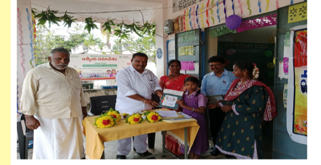
రాయల్ జర్నలిజం (బాపట్ల) డిసెంబర్ 07: కర్ణపాలెం మండలం నల్లమోతువారిపాలెం సెన్సెంట్ లోని నల్లమోతువారిపాలెం మరియు కొత్త నందాయపాలెం

చేతులమీదుగా బహుమతుల ప్రదానం చేశారు. తల్లిదండ్రులతో చర్చించి పలు సమస్యలకు సూచనలు సలహాలను తెలియ జేశారు. కార్యక్రమంలో పాఠశాల ఉపాధ్యాయులు, గ్రామాల పెద్దలు, తల్లిదండ్రులు మరియు విద్యార్థులు విద్యార్థులు పాల్గొన్నారు.