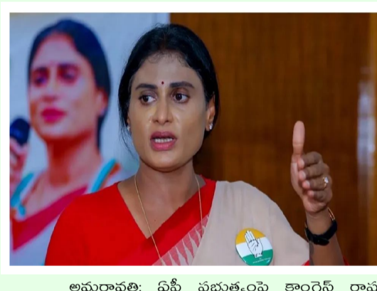
అమరావతి: ఏపీ ప్రభుత్వంపై కాంగ్రెస్ రాష్ట్ర అధ్యక్షురాలు షర్మిల విమర్శలు గుప్పించారు. రేషన్ బియ్యం

అక్రమ రవాణాపై ప్రభుత్వం సిట్ వేయడం సంతోషకరమైన విషయమని ప్రశంసించిన షర్మిల... వైసీపీ హయాంలో సోలార్ విద్యుత్ బియ్యంపై జరిగిన రూ. 1,750 కోట్ల ముడుపులపై ఎందుకు విచారణ జరపడం లేదని ప్రశ్నించారు. బియ్యం మాఫియాపై పెట్టిన శ్రద్ధ... అదానీ అక్రమ బియ్యంపై ఎందుకు పెట్టడం లేదని అడిగారు. అమలకా దర్మాపు సంస్థలు ఇచ్చిన నివేదికలకు విలువ లేదా? అని ప్రశ్నించారు. సీఎం జగన్ లంచాలు తీసుకున్నారని అమలకా దర్మాపు సంస్థలు నివేదిక ఇచ్చాయని... నిజాలును నిగ్గు తేల్చే బాధ్యత రాష్ట్ర ప్రభుత్వానికే లేదా? అని ప్రశ్నించారు. ఈ అంశంపై మానం వహిస్తున్నారని... విచారణ చేయకుండా ఉంటున్నారని విమర్శించారు. జగన్ తో పాటు అదానీని కూడా అరెస్ట్ చేయాల్సి వస్తుందని భయపడుతున్నారా? అని ప్రశ్నించారు. సీటీఆర్ కుదుర్చుకున్న