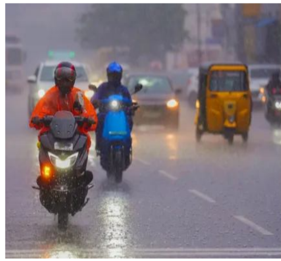
చంద్రబాబు అల్పపీడన ప్రభావంతో కురుస్తున్న వర్షాలతో సముద్రం కూడా

అమరావతి: బంగాళాఖాతంలో ఏర్పడిన అల్పపీడనం మరలంత బలపడటంతో ఆంధ్రప్రదేశ్ రాష్ట్ర వ్యాప్తంగా చాలా ప్రాంతాల్లో వర్షాలు విస్తారంగా కురుస్తున్నాయి. శీతాకాలంలోనూ కురుస్తున్న వర్షాలు అన్నదాతలకు ఇబ్బంది కలిగిస్తున్నాయి. ప్రస్తుతం బంగాళాఖాతంలో ఏర్పడిన అల్పపీడనం వాయు గుండంగా మారి ఉత్తర ఈశాన్య దిశగా కదులుతుందని భారత వాతావరణ శాఖ అంచనా వేసింది. ఉత్తరాంధ్రలో భారీవర్షాలు : ఈ క్రమంలో అల్ప పీడన ప్రభావంతో ఆంధ్రప్రదేశ్ రాష్ట్రంలోని ఉత్తరాంధ్రలో భారీవర్షాలు కురుస్తున్నాయి. శ్రీకాకుళం, విజయనగరం, పార్వతీపురం ముగ్గురు జిల్లాల్లో కొన్ని ప్రాంతాల్లో తేలికపాటి గుండ మోస్తూ వర్షాలు కురుస్తున్నాయి. ఇదే సమయంలో నేడు అల్లూరి సీతారామరాజు, విశాఖ పట్టణం, కాకినాడ, అనకాపల్లి, అంబేద్కర్ కోనసీ మ, తూర్పుగోదావరి, పశ్చిమ గోదావరి జిల్లాల్లో కూడా తేలికపాటి వర్షాలు కురుస్తున్నాయి. భారీ వర్షాలపై సీఎం అధికారులతో సమీక్ష చేసిన సీఎం