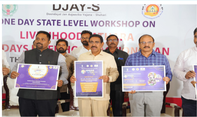
మహిళలకు అవగాహన కల్పించేందుకు క్షేత్ర స్థాయిలో మెప్పా సిబ్బంది బాగా పని చేయాలన్నారు మంత్రి నారాయణ.

మంత్రి నారాయణ శామెంట్స్.. మహిళలను ఆర్థికంగా బలోపేతం చేయడమే ప్రభుత్వ లక్ష్యం. మెప్పాలోని లక్ష మంది మహిళలతో ఎంఎస్ ఎంకెల ఏర్పాటు. తలసరి ఆదాయం పెంపు కోసం వందరోజుల ప్రణాళిక ఇంటికి వ్యాపారవేత్త ఉండాలనే సీఎం చంద్రబాబు లక్ష్యాలను అనుగుణంగా పనిచేయాలి. మెప్పా ప్రొఫెషింగ్ యాప్ ద్వారా ఇప్పటివరకూ 90 శాతం మంది సభ్యుల మ్యూజింగ్ పూర్తి.