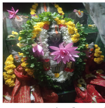
రామసముద్రం డిసెంబర్ 14 రాయల్

జర్నలిజం. రామసముద్రం ఉలపాడు పంచాయతీ దినేపల్లి సమీపంలో మోరకొండలో వెలసియుండు గెలిమరాయ స్వామి ఆలయము నందు శనివారం ప్రత్యేక పూజ కార్యక్రమాలు నిర్వహించారు. స్వామివారిని చూసేందుకు భక్తులు తండోపతండాలుగా తరలి వెళ్లి స్వామివారిని దర్శించుకున్నారు గోవింద నామస్మరణలతో ఆలయం ప్రాంగణం మారుమోగింది. స్వామివారికి ఉదయాన్నే అభిషేకాలు నిర్వహించి భక్తులకు దర్శన భాగ్యం కల్పించి స్వామి వారికి మహా మంగళహారతి భక్తులకు తీర్థప్రసాదాలు అందించారు. ఈ కార్యక్రమంలో భక్తులు తదితరులు పాల్గొన్నారు.