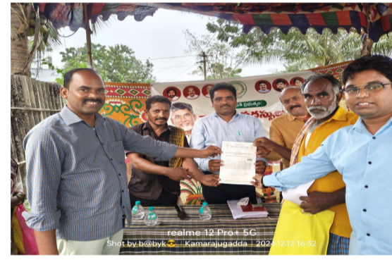
వర్గాలు చేశారని కొనియాడారు. ప్రతి రైతు తన భూమిని