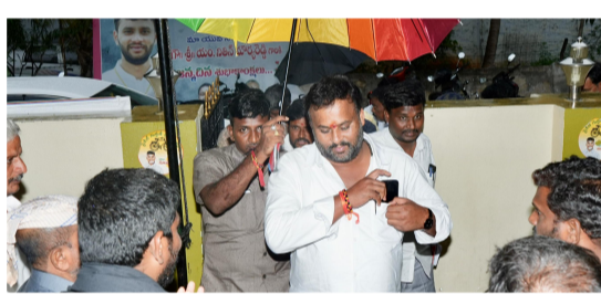
రాయల్ జర్నలిజం, రాయచోటి, నవంబర్