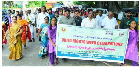
నిదేనని జిల్లా కలెక్టర్ చెప్పారు. బాలల హక్కులను పరిరక్షించాలి, అత్యంత అపరూపంగా బాలలను పెంచాలని

రాయల్ జర్నలిజం (బాపట్ల) నవంబర్ 14: బాలల దినోత్సవం సందర్భంగా బాపట్ల పట్టణంలో నిర్వహించిన ర్యాలీని జిల్లా కలెక్టర్ గురువారం జెండా ఊపి ప్రారంభించారు. తొలుత బాల సదస్ వద్ద ఏర్పాటుచేసిన చాలా నెహ్రూ చిత్రపటానికి జిల్లా కలెక్టర్ ఘనంగా నివాళులర్పించారు. మహిళా, శిశు సంక్షేమ శాఖ, జిల్లా విద్యాశాఖ ఆధ్వర్యంలో చేపట్టిన ర్యాలీ బాల సదస్ నుంచి పాత బస్టాండ్ కూడలి వరకు సాగింది. అనంతరం పాత బస్టాండ్ వద్ద మానవహారం నిర్వహించారు. బాలలను పనికి పంపవద్దు-బడికి పంపాలని, నేటి బాలల్-రేపటి పౌరులని బాల సదస్ లోని చిన్నారులు గురించారు. బాలలకు విద్యాసంబంధించే బాధ్యత ప్రభుత్వా