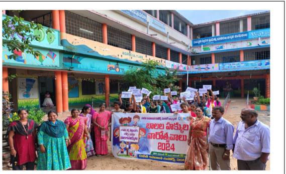
పిల్లల వద్ద తప్పక ప్రవర్తించడం కానీ తప్పక మార్పిడిచేయడం కానీ జరిగిన వెంటనే పట్టణానికి చెప్పాలని ఎటువంటి హాని జరగదని వివరించడం జరిగినది ఈ కార్యక్రమంలో సచివ్యుని మెమోరియల్ గద్దె పై స్కూల్ సిబ్బంది మలయ విద్యార్థిని విద్యార్థులు పాల్గొన్నారు.