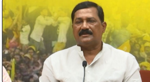
విశాఖపట్నం: దోచుకున్న ఆస్తులు కాపాడుకునేందుకు వైకాపా అధ్యక్షుడు జగన్ తాపత్రయ పడుతున్నారని మాజీ మంత్రి గంటా శ్రీనివాసరావు విమర్శించారు.