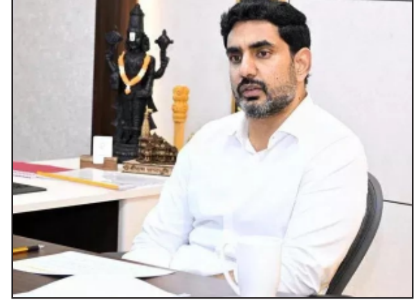
ఉద్యోగాల కల్పన కోసం మంత్రి నారా లోకేశ్ అమెరికాలో పర్యటిస్తున్నారు. ఇప్పటికే దిగ్గజ సంస్థలు రాష్ట్రానికి వస్తున్నట్లు లోకేశ్ ప్రకటించారు.

అమరావతి : అమెరికా పర్యటనలో ఏపీ మంత్రి నారా లోకేశ్ కీలక వ్యాఖ్యలు చేశారు. ఈరోజు ప్రపంచమంతా ఏపీవైపు చూస్తుందంటే అందుకు కారణం సీఎం చంద్రబాబే అన్నారు. ఐటీ మంత్రిగా టాటా చైర్మన్ చంద్రశేఖర్ నతో కేవలం 90 నిమిషాలు చర్చించి టీసీఎస్ తేగలిగానంటే దానికి కారణం కూడా చంద్రబాబే అన్నారు. ఒక్క మెయిల్ తో సత్యనాదెళ్ల అపాయింట్ మెంట్ ఇచ్చారని, తాను ఏదిగట్ట కంపెనీ వద్దకు వెళ్లినా రెడ్ కార్పెట్ తో వెల్కమ్ చెబుతున్నారన్నారు.