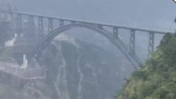
తెలిసింది. దీని నిర్మాణం పూర్తిచేయడానికి ప్రభుత్వానికి 20 ఏళ్లు పట్టింది. ఇటీవల ఈ వంతెనపై తొలి రైలు బ్రుయల్ రన్ ను విజయవంతంగా నిర్వహించారు.

శ్రీనిగర్: జమ్మూకశ్మీర్ లోని చీనాబ్ నదిపై నిర్మించిన ప్రపంచంలోనే అత్యంత ఎత్తయిన రైల్వే వంతెన పై పొరుగుదేశం పాకిస్తాన్ కన్నేసినట్లుగా ఇంటలిజెన్స్ వర్గాలు పేర్కొన్నట్లు పలు మీడియా సంస్థలు వెల్లడిస్తున్నాయి. జమ్మూకశ్మీర్లోని రైన్, రామబాద్ జిల్లాల మధ్య నిర్మిస్తున్న ఈ వంతెనకు సంబంధించిన వివరాలు సేకరించిన చైనా పాకిస్తాన్ కు కోరడంతో ఆ దేశ ఇంటలిజెన్స్ వర్గాలు ఈ బ్రిడ్జి గురించి చివర కీలకమైన విషయాలు తెలుసు కుంటున్నట్లు వార్తలు వస్తున్నాయి. అయితే ఆ వివరాలు ఎందుకు తెలుసుకుంటున్నారనే విషయంపై స్పష్టత లేదు. ప్రపంచంలోనే అత్యంత ఎత్తయిన చీనాబ్ రైల్వేవంతెన నిర్మాణం దాదాపు పూర్తయిన విషయం