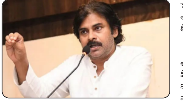
మెతక ప్రభుత్వం కాదని వైకాపా నేతలు గుర్తు పెట్టుకోవాలి. సోషల్ మీడియాలో ఆడబిడ్డలను ఇబ్బంది పెట్టే విధంగా పోస్టులు

జగన్మోహన్ రెడ్డి: 'దీపం 2.0' కేవలం వంటింట్లో వెలుగు కోసం మాత్రమే కాదు.. ప్రతి ఒక్కరి జీవితాల్లో వెలుగు తీసుకురావాలని డిమాండ్ చేసింది పవన్ కల్యాణ్ అన్నారు. ఏలూరు జిల్లా జగన్మోహన్ రెడ్డి ఏర్పాటు చేసిన సభలో పవన్ మాట్లాడారు. "ప్రజలు మాపై భరోసాతో ఉన్నారు. కూటమి ప్రభుత్వం అధికారంలోకి వచ్చేలా చేసి మాపై ఎంతో బాధ్యత పెట్టారు. వైకాపా చేసిన దోపిడీ కారణంగా అనేక ఇబ్బందులు తలెత్తాయి. వైకాపాను ప్రజలు తరిమికొట్టినా, కేవలం 11 సీట్లకే పరిమితమైనా వారి నోళ్లు ఆగడం లేదు. కూటమి ప్రభుత్వం చిత్తశుద్ధితో పనిచేసింది. సామాజిక మాధ్యమాల ద్వారా ఏది పడితే అది మాట్లాడుతాం అంటే మాత్రం చూస్తూ ఉర్రకోత. మాది మంచి ప్రభుత్వమే కానీ