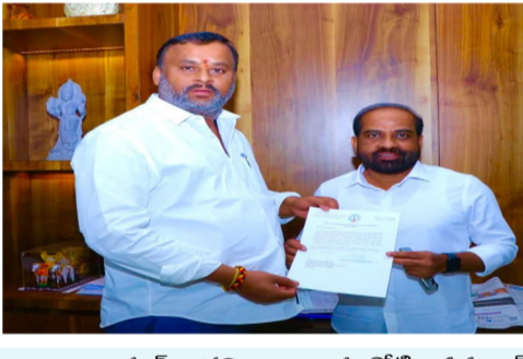
రాయల్ జర్నలిజం, రాయచోటి, నవంబర్ 22: తీవ్ర అనారోగ్యంతో ఉన్న రోగులకు సమగ్ర సంరక్షణ అందించడానికి రాయచోటిలో క్రిటికల్ టేర్ బ్లాక్ ను ఏర్పాటు కు 30 కోట్లు మంజూరు చేయనున్నట్లు ఆరోగ్య శాఖ మంత్రి హామీ ఇచ్చారు.

భారత ప్రభుత్వం ప్రవేశ పెట్టిన క్రిటికల్ టేర్ బ్లాక్ ఏర్పాటు విధానం ద్వారా తీవ్రమైన కేసులకు చికిత్స అందించే సౌకర్యాలు ప్రజలకు అందుబాటులో ఉంటాయని రాష్ట్ర ఆరోగ్య శాఖ మంత్రి సత్య కుమార్ యాదవ్ ను రవాణా, యువజన క్రీడా శాఖ మంత్రి మండిపల్లి రాంప్రసాద్ రెడ్డి కోరారు. క్రిటికల్ %౫౫ ట్రామా టేర్ సేవలకు పేరుగుతున్న డిమాండ్ కు అనుగుణంగా రోగులకు ప్రత్యేక సంరక్షణ, పర్యవేక్షణ అవసరం కాబట్టి, ప్రస్తుత %౫౫౫ సామర్థ్యం నిలిపివేసిన అందువల్ల మెరుగైన పేషెంట్ టేర్ కోసం రాయచోటిలో 50 పడకల క్రిటికల్ టేర్ బ్లాక్ ఏర్పాటుకు 30 కోట్ల మంజూరు చేయాలని రవాణా శాఖ మంత్రి కోరగా ఆరోగ్య శాఖ మంత్రి సానుకూలంగా స్పందించి 30 కోట్లు మంజూరు చేయనున్నట్లు తెలిపారు.