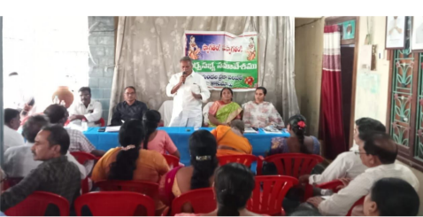
రాయల్ జర్నలిజం (కాకుమాను) స్థానిక కాకుమాను మండల ప్రజా పరిషత్ అభివృద్ధి కార్యాలయంలో శుక్రవారం మండల పరిషత్