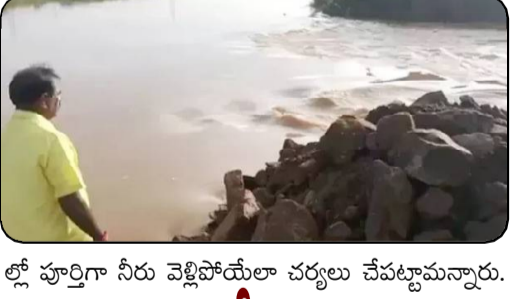
లో పూర్తిగా నీరు వెళ్లిపోయేలా చర్యలు చేపట్టామన్నారు.

పంట పొలాలు చెరువులను తలపించాయి, గండ్లు పూడ్చడంతో పొలాలు బయటపడుతున్నాయన్నారు. బుడమేరు పరివాహక ప్రాంతంలో మళ్లీ వర్షాలు పడి ప్రవాహం పెరిగే అవకాశం ఉందన్న మంత్రి.. 8వేల క్యూసెక్కుల వరదనీరు వచ్చే అవకాశం ఉందన్నారు. గండ్లు పూడ్చేతనే విజయవాడ దిగువ ప్రాంతాలకు బుడమేరు వరద నీరు అగిపోయిందన్నారు. జక్కంపూడి, సింగ్ నగర్, నిడమానూరు వరకు నిలిచిపోయిన నీటిని కొల్లెరుకు పంపేలా చర్యలు చేపట్టనున్నట్లు నిమ్మల తెలిపారు. ఒకట్రెండు రోజు