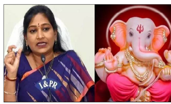
విగ్రహం 3-6 అడుగులంటే రూ.350, ఆరు అడుగుల పైన ఉంటే రోజుకు రూ.700 చలాన్లు కట్టాలి అని ఆమె చెప్పారు. దీంతో భక్తులు ఆగ్రహం వ్యక్తం చేస్తున్నారు.

అమరావతి : దేశవ్యాప్తంగా శనివారం గణేశుని ఉత్సవాలు ఘనంగా నిర్వహించడం జరుగుతోంది. ఈ క్రమంలో కొన్ని రోజుల నుంచే మండపాల ఏర్పాటుకు ప్రభుత్వం కొన్ని నిబంధనలు అమలు చేస్తోంది. గణేశ్ ఉత్సవాల సందర్భంగా ఎలాంటి అవాంఛనీయ సంఘటనలు జరగకుండా పోలీసులు బందోబస్తు ఏర్పాటు చేయడం జరిగింది. ఈ క్రమంలో భక్తులకు గణేశ్ మండపాల ఎలాంటి వాతావరణం ఉండాలనే దానిపై కూడా సూచనలు చేశారు. అసలు విషయంలోకి వెళ్తే.. గణేశ్ మండపాలకు అనుమతుల కోసం ప్రభుత్వం ఇటీవల సింగిల్ విండో విధానాన్ని తీసుకొచ్చింది. అయితే మైక్ పర్మిషన్ కు, విగ్రహం హైట్ ను బట్టి చలాన్లు కట్టాల్సి ఉంటుందని హెచ్చరికలు అనిత చెప్పడం వివాదాస్పదం అవుతోంది. మైక్ పర్మిషన్ రోజుకు రూ.100, ఎకో ఫ్రెండ్లీ