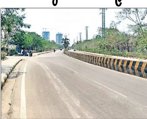
రోడ్డు ప్రవేశంలో కొంతమేర ప్రైవేటు స్థలాలు ఉండగా.. మిగతా అంతా బిడిఎల్ సంస్థకు చెందిన 240 ఎకరాల స్థలమే. 1961లో ఇక్కడ స్థాపించిన బిడిఎల్లో డికోనేటర్ తరుణ్ జరిగేది. తరచూ ఈ స్థావరంలో ప్రమాదాలు జరగడం.. కార్మికులు ప్రాణాలు కోల్పోతుండడంతో జనావాసాల మధ్య ఉన్న ఈ సంస్థను తరలించాలన్న డిమాండ్లు వచ్చాయి.

కూకట్పల్లి: రియల్ ఎస్టేట్ అత్యంత అభివృద్ధి చెందిన ప్రాంతాల్లో కూకట్పల్లి ఒకటి. ఒకప్పుడు ఏ చిన్న షాపింగ్ చేయాలన్నా.. అమీర్ పేట లేదా అబిడ్స్ వెళ్ళారు. క్రమంగా ఈ ప్రాంతం నిర్మాణ రంగంలో ప్రగతి పథంలోకి దూసుకొచ్చింది. ప్రసిద్ధి చెందిన మాల్స్ సైతం ఇక్కడ కొలువైదీరడంతో ఒక్కసారిగా పరిస్థితులు మారిపోయాయి. ప్రస్తుతం అమీర్ పేట మాత్రమే కాదు.. నగరంలోని పలు ప్రాంతాల నుంచి షాపింగ్ చేయాలంటే ఇక్కడికి వస్తున్నారంటే పరిస్థితిని అర్థం చేసుకోవచ్చు. మరికొన్ని మాల్స్ నిర్మాణం కూడా జరుగుతున్న నేపథ్యంలో రాబోయే రోజుల్లో మరింత అభివృద్ధిని సంతరించుకునే అవకాశం ఉంది. దీంతో భారీ నిర్మాణ సంస్థలు సైతం ఇటుగా దృష్టి సారించాయి. ప్రస్తుతం వందల ఎకరాలలో గేటెడ్ కమ్యూనిటీలు అందుబాటులోకి రానున్నాయి. ఇక్కడ భూముల ధరలకు రెక్కలొచ్చాయి. కొన్ని ప్రాంతాలకే పరిమితమైన రూ. లక్షల్లో ధర.. ప్రస్తుతం డిమాండ్ ఉన్న అన్ని ప్రాంతాలకు విస్తరించడం గమనార్హం.