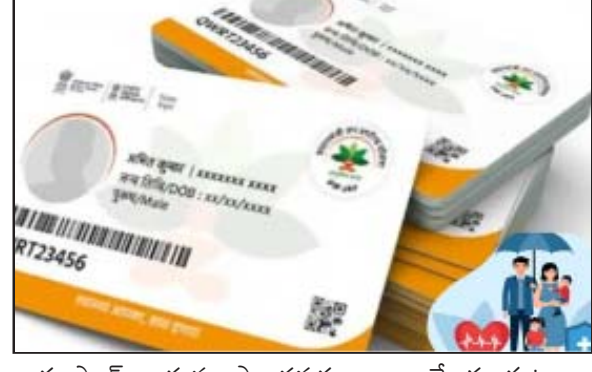
ఆయుష్మాన్ కార్డును పొందవచ్చు. అయితే ఈ కుటుంబ సభ్యులందరూ ఈ పథకానికి అర్హులై ఉండాలి.

అమరావతి : ఆయుష్మాన్ భారత యోజన అనేది ప్రజలకు ఉచిత చికిత్స అందించే పథకం. ప్రభుత్వం అమలు చేస్తున్న ఈ హెల్త్ సీమ్ లో దరఖాస్తు చేసుకున్న తర్వాత అది ఆయుష్మాన్ కార్డుగా మారి దీని ద్వారా రూ.5 లక్షల వరకు ఉచిత చికిత్స అందించవచ్చు. ప్రభుత్వం మీకు ప్రతి సంవత్సరం ఇంత మొత్తంలో కవర్ ఇస్తుంది. మొత్తం ఖర్చును ప్రభుత్వం భరిస్తుంది. బుధవారం ఈ ప్రభుత్వ పథకంలో పెను మార్పు తీసుకురాగా, 70 ఏళ్లు పైబడిన వృద్ధులందరినీ 'ఆయుష్మాన్ యోజన'లో చేర్చాలని మంత్రివర్గ సమావేశంలో నిర్ణయించారు.