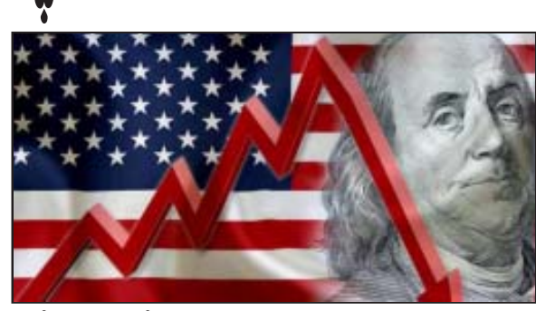
ప్రైవేట్ రంగంలో 46.4 శాతం. 452 కంపెనీలు దివాలా..

న్యూఢిల్లీ : అమెరికాలోని తాజా గణాంకాల ప్రకారం దేశ ఆర్థిక వ్యవస్థ మందగమనంలో ఉంది. ఈ నేపథ్యంలో వచ్చే వారం జరిగే పాలిసి సమావేశంలో ఫెడరల్ రిజర్వ్ వడ్డీ రేట్లను 25 బేసిస్ పాయింట్లు తగ్గించే అవకాశం ఉంది. అమెరికా ప్రపంచంలోనే అతిపెద్ద ఆర్థిక వ్యవస్థ, అక్కడ మార్కెట్ల మొత్తం ప్రపంచాన్ని ప్రభావితం చేస్తుంది. తాజా నివేదికల ప్రకారం.. గత మూడు నెలల్లో అమెరికాలోని చిన్న కంపెనీల ఆదాయాల్లో 37 శాతం క్షీణితం ఉంది. 2010 తర్వాత ఇదే అత్యధికం. 2020లో కరోనా కాలంలో కూడా ఇలా జరగలేదు. అప్పుడు 35 శాతం చిన్న కంపెనీల ఆదాయాల్లో క్షీణితం ఉంది. లెబర్, మెటీరియల్ ఖర్చులు పెరగడం, అమృతాలు క్షీణించడం కంపెనీల ఆదాయాలను దెబ్బతీశాయి. ఇటీవల.. చిన్న కంపెనీల అమృతాల సామర్థ్యం నాలుగేళ్లలో కనిష్ట స్థాయికి పడిపోయింది. దేశ ఆర్థిక వ్యవస్థ తిరోగమనంలో కూరుకుపోవడంతో అమెరికాలోని చిన్న కంపెనీలు ఇబ్బందుల్లో పడుతున్నాయి. అమెరికాలో 3.3 కోట్ల చిన్న కంపెనీలు ఉండగా దేశ ఆర్థిక వ్యవస్థలో 44% వాటాను కలిగి ఉన్నాయి. ఈ కంపెనీల్లో 6.17 కోట్ల మంది పనిచేస్తున్నారు. ఇది మొత్తం