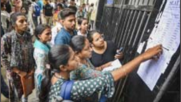
రెండు అర్హత పరీక్షలు.. వివిధ సర్వీసులు, పోస్టులకు అభ్యర్థులను ఎంపిక చేసేందుకు ఈ పరీక్షలను నిర్వహిస్తారు.

అమరావతి : సివిల్ పరీక్షలు రాసే అభ్యర్థులకు అల్ట్రా.. యూనియన్ పబ్లిక్ సర్వీస్ కమిషన్ తాజాగా సివిల్ మెయిన్స్ అడ్మిట్ కార్డు 2024లను విడుదల చేసింది. ఈ పరీక్షలకు హాజరయ్యే అభ్యర్థులు సివిల్ అధికారిక వెబ్ సైట్ లోకి వెళ్లి upsc.gov.in తమ అడ్మిట్ కార్డులను డౌన్లోడ్ చేయగలరు. అభ్యర్థులు యూపీఎస్సీ అధికారిక వెబ్ సైట్, upsonline.nic.in సంప్రదించగలరు. సివిల్ మెయిన్స్ అడ్మిట్ కార్డులు సెప్టెంబర్ 29 వరకు అందుబాటులో ఉంటాయని అధికారులు తెలిపారు. యూపీఎస్సీ సివిల్ సర్వీస్ మెయిన్స్ పరీక్షలు సెప్టెంబర్ 20, 21, 22, 28, 29 తేదీల్లో నిర్వహించనున్నారు. ఈ పరీక్షలు రెండు షిఫ్ట్లలో జరగనున్నాయి. మొదటి షిఫ్ట్ ఉదయం 9 గంటల నుంచి మధ్యాహ్నం 12 గంటల వరకు జరగగా, రెండో షిఫ్ట్ మధ్యాహ్నం 2.30 గంటల నుంచి సాయంత్రం 5.30 గంటల వరకు నిర్వహిస్తారు. యూపీఎస్సీ 1056 పోస్టుల భర్తీకి ఈ ఏడాది ఫిబ్రవరిలో నోటిఫికేషన్ విడుదల చేసింది. వీటికి దరఖాస్తు ప్రక్రియ ఫిబ్రవరి 14వ తేదీన ప్రారంభమయ్యి, మార్చి 5వ తేదీన ముగిసింది. సివిల్ ప్రీలిమ్స్ పరీక్షను జూన్ 16, 2024 న నిర్వహించారు. వీటి ఫలితాలను జూలై 1, 2024 విడుదల చేశారు. ప్రీలిమ్స్ పరీక్షలో ఉత్తీర్ణులైన అభ్యర్థులను మాత్రమే మెయిన్స్ పరీక్షకు అర్హత సాధిస్తారు. సివిల్ సర్వీస్ మెయిన్స్ ఎగ్జామినేషన్ లో రాత పరీక్ష, ఇంటర్వ్యూ/పర్యవేక్షణ టెస్టులు నిర్వహిస్తారు. రాత పరీక్షలో తొమ్మిది సంప్రదాయ వ్యాస పత్రాలు ఉంటాయి. వీటిలో