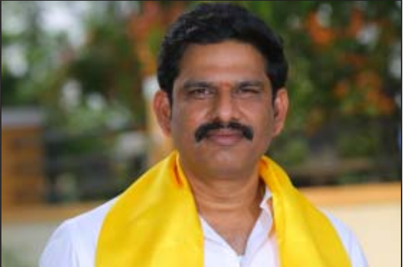
రాయల్ జర్నలిజం ( బాపట్ల ) సెప్టెంబర్ 14 : కొమ్మమూరు కాలవ అయకట్టు రైతాంగం అద్దెర్న పడవద్దని పంటలకు సాగునీరు