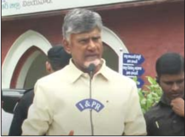
విజయవాడ: వరద బాధితుల సమస్యలను పరిష్కరించేందుకు అన్ని చర్యలూ చేపట్టమని ఏపీ సీఎం చంద్రబాబు తెలిపారు. కొన్ని చోట్ల ఆహారం అందలేదని ఫిర్యాదులు వస్తున్నాయన్నారు. అధికారులు నిర్లక్ష్యంగా వ్యవహరిస్తే సహించేది

లేదని.. కఠిన చర్యలు తప్పవని హెచ్చరించారు. విజయవాడ కలెక్టరేట్ వద్ద మీడియాతో సీఎం మాట్లాడారు. సగంరోజు డివిజన్ కు ఒక సీనియర్ ఐఏఎస్ ను నియమించామని చెప్పారు. 32 మంది ఐఏఎస్ అధికారులు సహాయక చర్యల్లో ఉన్నారన్నారు. పది జిల్లాల నుంచి ఆహారం సమకూర్చామని.. బాధితులకు మూడు పూటలా అందించాలని ఆదేశించినట్లు చెప్పారు. చిట్టచివరి బాధితుడికి కూడా సాయం అందాలని స్పష్టం చేశారు.