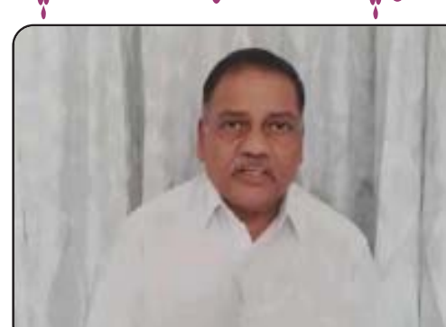
నిర్వహణ చేయకపోవడంతో వాటి నుంచి లీకేజీలను అడ్డుకునేందుకు (మిగతా 4వ పేజీలో)