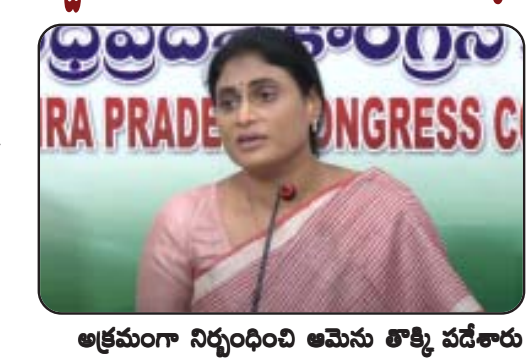
అక్రమంగా నిర్బంధించి ఆమెను తొక్కి వదేశారు “సజ్జన్ జిందార్, జగన్ మధ్య సాన్నిహిత్యాన్ని గొప్పగా చెప్పుకొన్నారు. జిందార్ కు ఎందుకు ఇన్ని కోట్లరూపాయలు (మిగతా 4వ పేజీలో)

కడప: కేంద్రంలో ఉన్న ఎన్టీయే ప్రభుత్వం కడప స్టీల్ ప్లాంట్ పై ఏమాత్రం స్పందన లేకుండా వ్యవహరిస్తోందని ఏపీ కాంగ్రెస్ అధ్యక్షురాలు వైఎస్ షర్మిల విమర్శించారు. ఉక్కు పరిశ్రమ నిర్మాణం పూర్తిచేయాలని వైఎస్ఆర్ జిల్లా కలెక్టర్ కు ఆమె వినతిపత్రం అందజేశారు. మాజీ సీఎం జగన్ గత ఏడాది స్టీల్ ప్లాంట్ కు శంకుస్థాపన చేసినా దాని గురించి పట్టించుకోలేదని ఆరోపించారు. పరిశ్రమ ఏర్పాటుపై కాంగ్రెస్ తరఫున పోరాటం చేస్తామని చెప్పారు. ముంబయి నటి కార్దంబరి జత్నాని వ్యవహారంపైనా షర్మిల స్పందించారు. ఈ విషయంలో జగన్పై పలు విమర్శలు చేశారు. ఆమెను ఎలా కట్టడి చేయాలి జగన్, సజ్జన్ జిందార్ షాన్ చేశారని ఆరోపించారు.