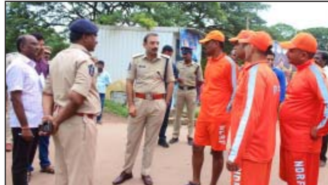
పరిశీలించారు. కొల్లూరు లాకులు ప్రాంతం వద్ద ఉండి డ్రోస్ సహాయంతో అనుక్షణం పరిస్థితులను పర్యవేక్షిస్తున్నారు. ప్రజలను త్వరితగతిన పునరావాస కేంద్రాలకు తరలించాలని, (విగతా 4వ పేజీలో)