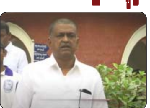
పునరావాస కార్యక్రమాలకు షరతులు, నిబంధనలు అడ్డురాకూడదని అధికారులను సీఎం ఆదేశించారు. కేంద్ర హోంమంత్రితోనూ ఆయన మాట్లాడారు. ఎక్స్ పోస్ట్, ఎక్స్ పోస్ట్తో సమన్వయం చేస్తున్నారు. ప్రభుత్వం తన బాధ్యతను మించి పనిచేసే లక్ష్యంతో ముందుకెళ్తోంది" అని పయ్యప్పల కేకెవ్ అన్నారు.