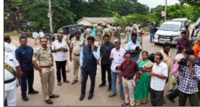
రాయల్ జర్నలిజం (బాపట్ల ) సెప్టెంబర్ 2 : ప్రజలు అడ్డూర్ పడవద్దని, సహాయం అందించడానికి పోలీస్ శాఖ సిద్ధంగా ఉందని జిల్లా ఎస్సీ తుషార్ దూడి ప్రజలకు భరోసా కల్పిస్తున్నారు. కృష్ణానది ఉధృతంగా ప్రవాహిస్తున్నంతో అరవింద వారిది సమీపంలో కృష్ణానది కట్టకు గండిపడటంతో కొల్లూరు, భట్లపాలెం మండలాలలోని గ్రామాలు వరద ముంపునకు గురైనాయి. నిస్ఫటి నుండి ఎస్సీ కొల్లూరు లోనే ఉంటూ ఎప్పటికప్పుడు పరిస్థితులను సమీక్షిస్తున్నారు. సోమవారు పెనుమూడి వారిది, డోనేపూడి గ్రామం, చుట్టుపక్కల లోతట్టు ప్రాంతాలలోని పరిస్థితులను