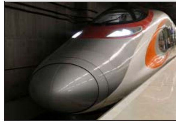
On which routes will India-built bullet trains run?

India will soon see home-built bullet trains chugging on various routes. Interestingly, India-built bullet trains, work on which has already begun, will be faster than any of the trains which are currently being plied by the Indian Railways. A report by Economic Times quoted a top government official saying that India made bullet train will run at the speed of over 250 kilometres per hour (kmph). The speed of home-built bullet trains in India will be similar to high-speed trains in various parts of the globe which ply at over 250 kmph including the French TGV and the Japanese Shinkansen.