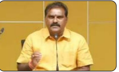
విజయవాడ: కృష్ణా నదిలో ఇంత వరదనీరు ఎప్పుడూ చూడలేదని మంత్రి నిమ్మల రామనాయుడు అన్నారు. 1998, 2009 కంటే ఎక్కువగా ఇప్పుడు

వరద నీరు వచ్చిందని చెప్పారు. విజయవాడలో ఆయన మీడియాతో మాట్లాడుతూ.. వరద ప్రాంతాల్లో సమర్థంగా సహాయ చర్యలు అందిస్తున్నట్లు చెప్పారు. సీఎం స్వయంగా వరద ప్రాంతాల్లోనే ఉండి పర్యవేక్షిస్తున్నారన్నారు. "బుడమేరుకు గండ్లు.. గత ప్రభుత్వ పాలనా వైఫల్యం. బందేశ్గా బుడమేరులో లైనింగ్, ఎక్స్ టెన్షన్ పనులు చేయలేదు. కన్యూయ్ నాయుడుని ప్రకాశం బ్యారేజీ వద్దకు తీసుకెళ్లవచ్చు. అక్కడ అడ్డుకున్న వడవలను తీసేందుకు చర్యలు తీసుకుంటాం. సంక్షోభ సమయాల్లో ఎలా పనిచేయాలో చంద్రబాబుకు తెలుసు. వైకాపా నేతల విమర్శలను పట్టించుకోక" అని మంత్రి నిమ్మల తెలిపారు.