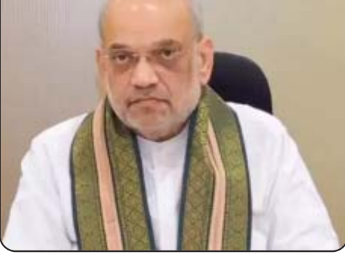
రాయ్ పుర్: మావోయిస్టుల హింస ప్రజాస్వామ్యానికి సవాలుగా మారినది కేంద్ర హెంకంపంత్రి అమిత్ షా పేర్కొన్నారు. ఇప్పటివరకు 17 వేలమంది దీనికి బలయ్యారని తెలిపారు. ఈ నేపథ్యంలోనే నక్సల్స్ అంతానికి బలమైన, పకడ్బందీ పూహం అవసరమన్నారు. ఈ

ఆమోదయోగ్యం కాదని, వెంటనే ఆపేయాలని ఎక్స్ వేదికగా పోస్ట్ చేశారు. నేరారోపణలు ఎదుర్కొంటున్న వ్యక్తి నేరం చేస్తే కోర్టు వారిని శిక్షిస్తుంది. ఆరోపణలు మోపిన వెంటనే ఆ వ్యక్తిని శిక్షించడం, వారి ఇంటిని కూల్చేయడం అంటే అది చట్టాన్ని పాటించకపోవడం. చట్టాన్ని కాపాడేవారికి, ఉల్లంఘించేవారికి మధ్య చాలా వ్యత్యాసం ఉంటుంది. ప్రభుత్వాల నేరస్థుల్లా ప్రవర్తించకూడదు. రాజ్యాంగం, ప్రజాస్వామ్యం, మానవత్వం.. వీటిని పాటించాలి. రాజధర్మం నెరవేర్చలేని వారు ప్రజా శత్రువులు, దేశ సంరక్షణకు పనిచేయలేరు. బుల్డోజర్లతో న్యాయం చేయడం ఆమోదయోగ్యం కాదు. కూల్చివేయడాలు వెంటనే ఆపేయాలి' అని ఆమె పేర్కొన్నారు. ఇటీవల ఓ అధ్యాత్మికవేత్త ఆరోపణలకు నిరసనగా ఛత్తాపూర్ జిల్లాలో నిరసన ప్రదర్శనలు జరిగాయి. నిరసన నమయంలో పలు హింసాత్మక ఘటనలు చోటుచేసుకున్నాయి. ఈ ఘటనలకు కారణమైన ఓ వ్యక్తి ఇంటిని బుల్డోజర్లతో కూల్చేయడం గమనార్హం. ఇక, నిరసనల్లో ఇద్దరు పోలీసులకు గాయాలవడంతో పాటు పలు వాహనాలు దెబ్బతిన్నాయని పోలీసులు తెలిపారు. నిరసనలో పాల్గొన్న 150 మందిపై కేసు నమోదు చేసినట్లు వెల్లడించారు.