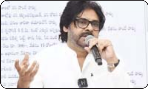
అభివృద్ధిపై ప్రత్యేక దృష్టిపెట్టాలని సూచించారు. ఈ నెల 30న రాష్ట్రవ్యాప్తంగా నిర్వహించనున్న వన మహోత్సవ కార్యక్రమాన్ని విజయవంతం చేయాలని, ఇందులో యువత భాగస్వామ్యాన్ని పెంచాలని అధికారులకు స్పష్టం చేశారు. ప్రతి గ్రామం, పట్టణం, నగరంలో మొక్కలు నాటి కార్యక్రమాన్ని ఒక వేడుకలా చేయాలని, ప్రభుత్వ శాఖలతోపాటు అన్ని విద్యా సంస్థలు, విశ్వ విద్యాలయాలు, పరిశ్రమలు, పేపర్ మిల్లులు, అధ్యాత్మిక సంస్థలు.. అన్నింటినీ ఇందులో పాలుపంచుకోవాలని చేయాలని అధికారులకు దిశ నిర్దేశం చేశారు.

అమరావతి: రాష్ట్రంలో నగరాలు, పట్టణ ప్రాంతాల్లో నగర వనాల అభివృద్ధికి కేంద్ర ప్రభుత్వం నిధులు మంజూరు చేసిందని ఏపీ ఉప ముఖ్యమంత్రి, అటవీ, పర్యావరణ, శాస్త్రసాంకేతిక శాఖ మంత్రి పవన్ కల్యాణ్ తెలిపారు. 11 మున్సిపల్ కార్పొరేషన్లు, మున్సిపాలిటీల పరిధిలో నూతనంగా నగర వనాల అభివృద్ధి కోసం తొలి విడతగా కేంద్రం రూ. 15.4 కోట్లను మంజూరు చేసిందన్నారు. ఈ నిధులతో కర్నూలు, కడప, నెల్లూరు, చిత్తూరులో రెండు, శ్రీకాళహస్తి, తాడేపల్లిగూడెం, పెనుకొండ, కడప, పల్నాడు, విశాఖపట్టణంలో నగరవనాలను అభివృద్ధి చేస్తామని తెలిపారు. అటవీ శాఖ అధికారులతో శనివారం పవన్ కల్యాణ్ చర్చించారు. ప్రస్తుతం రాష్ట్రంలో 50 నగర వనాల అభివృద్ధి పనులు వేగంగా సాగుతున్నాయని, రాబోయే 100 రోజుల్లో 30 నగర వనాల పనులు పూర్తి కావ్వచ్చు అని అధికారులు ఉప ముఖ్యమంత్రికి వివరించారు. కేంద్రం నుంచి వస్తున్న నిధులను సద్వినియోగం చేసుకోవడం ద్వారా రాష్ట్రంలో పచ్చదనాన్ని పెంపొందించే అవకాశాలు లభించాయని తెలిపారు. రాష్ట్రంలో పచ్చదనం 50శాతం మేరకు ఉండాలని, ఇందులో భాగంగా నగర వనాలు