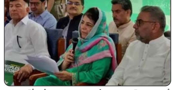
విత్ విద్యుత్తే బీ మసీదులు, గుడులు, పుణ్యక్షేత్రాలకు విద్యుత్ బిల్లుల రద్దు బీ నీటిపై పన్ను రద్దు, ఏడాదికి 12 సిలింగ్ రద్దు, సామాజిక పెన్షన్ల రద్దు వంటి హామీలు ఇచ్చారు.

శ్రీనగర్: జమ్మూకశ్మీర్ అసెంబ్లీ ఎన్నికల కోలాహలం ప్రారంభమైంది. వచ్చే నెల జరిగే ఎన్నికలకు ఇప్పటికే కాంగ్రెస్, నేషనల్ కాన్ఫెడరేషన్ పాత్తును ప్రకటించి సీట్ల సర్దుబాటు చర్యలు నెరుపుతున్నాయి. తాజాగా పీపుల్స్ డెమోక్రటిక్ పార్టీ అధినేత్రి, మాజీ ముఖ్యమంత్రి మోహబాబా ముష్టి పార్టీ మేనిఫెస్టోను విడుదల చేశారు. ఈ సందర్భంగా కాంగ్రెస్, ఎన్డీకే పాత్తు గురించి కీలక వ్యాఖ్యలు చేశారు. ఆ రెండు పార్టీల పాత్తుకు ఓ ఎజెండా లేదని ముష్టి విమర్శించారు. కేవలం సీట్ల పంపకం కోసమైతే తాము ఏ కూటమిలోనూ చేరబోమని చెప్పారు. ఒకవేళ తమ ఎజెండాకు కాంగ్రెస్, నేషనల్ కాన్ఫెడరేషన్ పార్టీలు ఓకే అంటే.. తాము ఏకంగా పోటీ నుంచే తప్పుకుంటామని చెప్పారు. కశ్మీర్ సమస్యల పరిష్కారమే తమకు ప్రాధాన్యం తప్ప ఇంకేదీ ముఖ్యం కాదన్నారు.