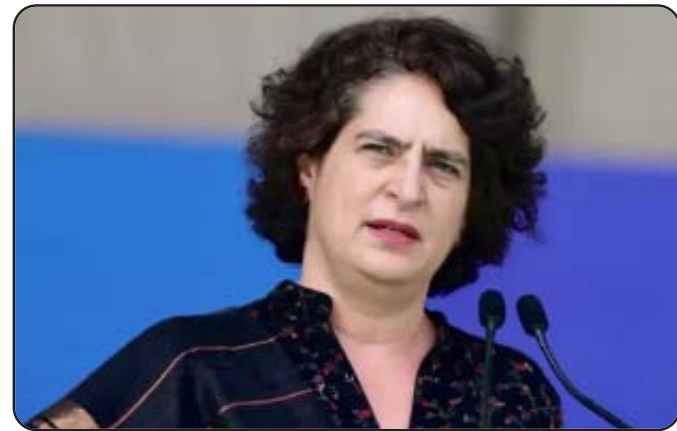
దిల్లీ: ఇటీవల మధ్యప్రదేశ్ లోని ఛత్తాపూర్ జిల్లాలో జరిగిన నిరసనల్లో పాల్గొన్న వ్యక్తి ఇంటిని బుల్డోజర్లతో కూల్చివేయడంపై కాంగ్రెస్ అగ్రనాయకురాలు ప్రియాంక గాంధీ మండిపడ్డారు. బుల్డోజర్లతో న్యాయం

ఆమోదయోగ్యం కాదని, వెంటనే ఆపేయాలని ఎక్స్ వేదికగా పోస్ట్ చేశారు. నేరారోపణలు ఎదుర్కొంటున్న వ్యక్తి నేరం చేస్తే కోర్టు వారిని శిక్షిస్తుంది. ఆరోపణలు మోపిన వెంటనే ఆ వ్యక్తిని శిక్షించడం, వారి ఇంటిని కూల్చేయడం అంటే అది చట్టాన్ని పాటించకపోవడం. చట్టాన్ని కాపాడేవారికి, ఉల్లంఘించేవారికి మధ్య చాలా వ్యత్యాసం ఉంటుంది. ప్రభుత్వాల నేరస్థుల్లా ప్రవర్తించకూడదు. రాజ్యాంగం, ప్రజాస్వామ్యం, మానవత్వం.. వీటిని పాటించాలి. రాజధర్మం నెరవేర్చలేని వారు ప్రజా శత్రువులు, దేశ సంరక్షణకు పనిచేయలేరు. బుల్డోజర్లతో న్యాయం చేయడం ఆమోదయోగ్యం కాదు. కూల్చివేయడాలు వెంటనే ఆపేయాలి' అని ఆమె పేర్కొన్నారు. ఇటీవల ఓ అధ్యాత్మికవేత్త ఆరోపణలకు నిరసనగా ఛత్తాపూర్ జిల్లాలో నిరసన ప్రదర్శనలు జరిగాయి. నిరసన నమయంలో పలు హింసాత్మక ఘటనలు చోటుచేసుకున్నాయి. ఈ ఘటనలకు కారణమైన ఓ వ్యక్తి ఇంటిని బుల్డోజర్లతో కూల్చేయడం గమనార్హం. ఇక, నిరసనల్లో ఇద్దరు పోలీసులకు గాయాలవడంతో పాటు పలు వాహనాలు దెబ్బతిన్నాయని పోలీసులు తెలిపారు. నిరసనలో పాల్గొన్న 150 మందిపై కేసు నమోదు చేసినట్లు వెల్లడించారు.