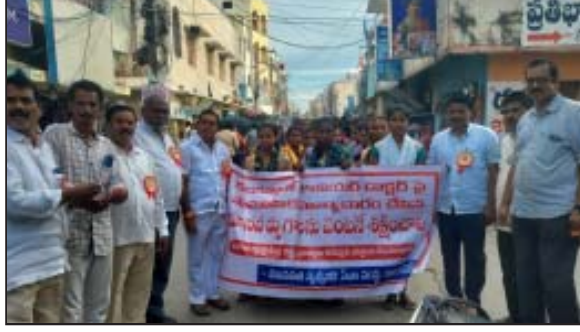
నుండి తహసిల్దార్ కార్యాలయం బస్టాండ్ సర్కిల్ మీదగా నేతాజీ కూడలి వరకు కొనసాగింది. నేతాజీ కూడలి వద్ద మనవహరంగా