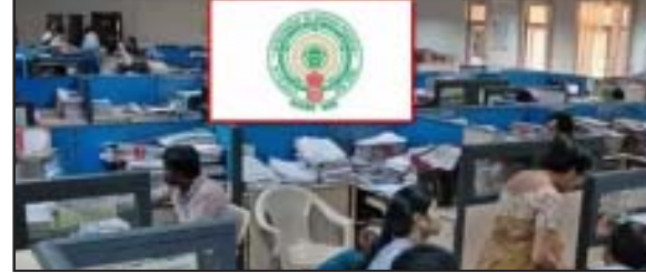
అమరావతి : ఏపీలో ఉద్యోగుల బదిలీలకు మార్గదర్శకాలు జారీ అయ్యాయి. మొత్తం 12 శాఖల్లో బదిలీలు చేపట్టేందుకు ప్రభుత్వం ఆమోదం తెలిపింది. ఈ ప్రక్రియను ఈ నెల 31 లోపు

పూర్తి చేయాలని నిర్ణయించింది. ప్రజలతో నేరుగా సంబంధాలుండే శాఖల్లో తొలుత బదిలీలు చేపట్టేందుకు నిర్ణయించింది. గ్రామ, వార్డు సచివాలయాల ఉద్యోగులతో పాటు రెవెన్యూ, ల్యాండ్స్, సివిల్ సప్లై, గనులు, పంచాయతీ రాజ్ శాఖ, ఇంజనీరింగ్ విభాగాల్లో అధికారులను బదిలీ చేయనుంది. బడెట్ల ఒకే చోట ఉద్యోగం చేస్తున్న వారిని తప్పని సరిగా బదిలీ చేయాలని నిర్ణయించుకుంది. ఈ మేరకు ఉద్యోగుల బదిలీలకు రాష్ట్ర ప్రభుత్వం మార్గదర్శకాలు జారీ చేసింది. కాగా విద్య, వైద్యం, వ్యవసాయం, వెటర్నరీ, ఎక్సైజ్, ఇతర శాఖల్లో మరికొన్ని రోజుల తర్వాత బదిలీ చేయాలని ప్రభుత్వం నిర్ణయించింది.