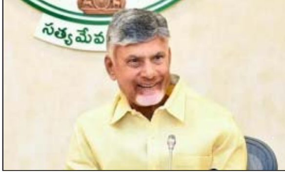
అమరావతి: కీలక పదవుల భర్తీ దిశగా ముఖ్యమంత్రి

చంద్రబాబు అడుగులు వేస్తున్నారు. ఇప్పటికే భాగస్వామ్య పక్షాలతో చర్చించారు. కొన్ని ముఖ్యమైన పదవుల భర్తీ పైన ఒక నిర్ణయానికి వచ్చినట్లు తెలుస్తోంది. కేంద్రం లో టీడీపీ భాగస్వామిగా ఉంది. దీంతో.. ఢిల్లీలో ఏపీ ప్రభుత్వ అధికార ప్రతినిధిగా ఎవరికి అవకాశం ఇస్తారనేది కీలకంగా మారుతోంది. నలుగురు ముఖ్యులు పోటీ పడుతున్నారు. మారుతున్న రాజకీయ సమీకరణాల్లో చంద్రబాబు నిర్ణయం ఆసక్తి కరంగా మారుతోంది. ధిల్లీ పదవి కోసం : ఢిల్లీలో రాష్ట్ర ప్రభుత్వ ప్రత్యేక ప్రతినిధి పదవిని నలుగురు ముఖ్య నేతలు ఆశిస్తున్నారు. ఈ నలుగురికి చంద్రబాబుతో సన్నిహిత సంబంధాలు ఉన్నాయి. ఢిల్లీలో ప్రస్తుతం ఉన్న పదవిని తమకు అవకాశం ఇవ్వాలని కోరుతున్నారు.