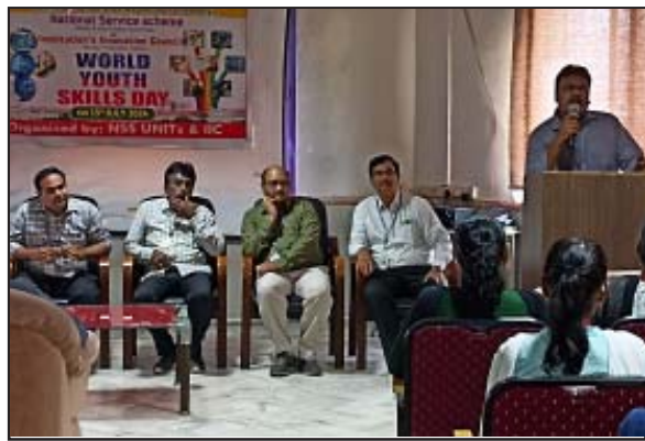
Royal Journalism ( Bapatla ) July 15 : World Youth Skills Day was organized at Bapatla Engineering College under the auspices of NSS Units and Institu-