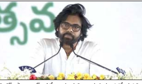
విక్రమ్ సారాభాయ్ కృషి కారణమని, ఆయన స్ఫూర్తితో మరిన్ని పరిశోధనలు అవిష్కరణలు కావాలని పవన్ ఆకాంక్షించారు.

అమరావతి: భారత అంతరిక్ష పితామహుడు విక్రమ్ సారాభాయ్ జీవితం స్ఫూర్తి దాయకమని ఏపీ డిప్యూటీ సీఎం పవన్ కల్యాణ్ అన్నారు. సారాభాయ్ జయంతి సందర్భంగా ఆయనకు నివాళులర్పించారు. శాస్త్రవేత్తల ఆలోచనలు సమాజానికి ఎంతో మేలు చేస్తాయని చెప్పారు. అంతరిక్షంలో గణనీయమైన విజయాలకు