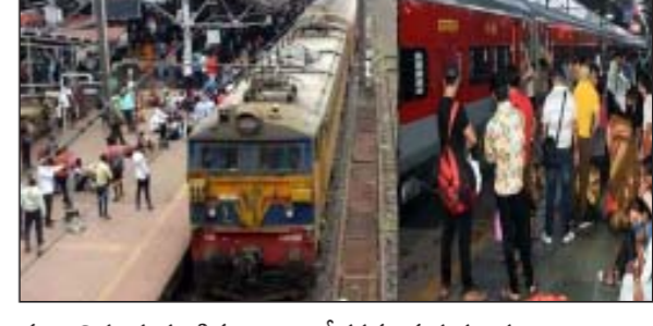
గుర్తించిన ప్రయాణికులు ఆందోళనకు గురయ్యారు.

బీదర్ : షిర్డీ టా కౌన్సిలర్ల పోర్టు ఎక్స్ ప్రెస్ రైలులో దొంగలు రెచ్చిపోయారు. రైలులో ప్రయాణికులు నిద్రిస్తున్న సమయాన్ని ఆసరాగా చేసుకుని మూడు బోగీల్లో బంగారం, నగదు, లగేజీని దొంగిలించారు. దీంతో, బీదర్ వద్ద రైలును నిలిపివేసి ప్రయాణికులు ఆందోళనకు దిగారు. వివరాల ప్రకారం.. సాయి నగర్ షిర్డీ టా కౌన్సిలర్ల పోర్టు ఎక్స్ ప్రెస్ రైలులో భారీ దోపిడీ జరిగింది. మహారాష్ట్రలోని వర్ధి సమీపంలో రైలులో ఎక్కిన దొంగలు దోపిడీకి పాల్పడ్డారు. ప్రయాణికులు నిద్రిస్తున్న సమయంలో వారివద్ద నుంచి బంగారం, నగదు, లగేజీని దొంగిలించారు. ఈ క్రమంలో దోపిడీని