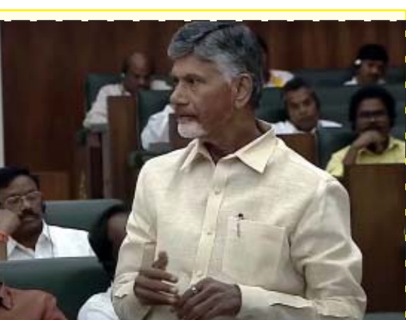
ఎక్సైజ్ శాఖ ప్రక్షాళన చేస్తాం ప్రభుత్వంలోని ఇతర శాఖల్లో దుబ్బాసు తీసుకొచ్చి ఎక్సైజ్ శాఖలో పెట్టుబడి పెట్టించారు. దీంతో ఆయా శాఖలకు దాదాపు రూ. 250 కోట్ల నష్టం వాటిల్లింది. ఎక్సైజ్ శాఖను పూర్తిగా ప్రక్షాళన చేయాలి. సరైన పాలీసీలు తీసుకొచ్చి పేదలకు అందుబాటు ధరలో మద్యం లభించే విధంగా చూడటంతోపాటు డీఆడిక్లన్ సింబల్ గ్రూపు ఏర్పాటు చేయాలి అవసరమంది. ఏ విధంగా ప్రక్షాళన చేయాలి శాసనసభ్యులు సలహాలు, సూచనలు ఇవ్వాలి. తప్పచేసిన వాళ్లను కఠినంగా శిక్షిస్తేనే మళ్లీ తప్పు జరగకుండా ఉంటుంది. మంత్రులంతా వారి శాఖల్లోని అవకతవల్ని వెలికితీయాలి" అని చంద్రబాబు సూచించారు.

అమరావతి: ఆంధ్రప్రదేశ్ లో జరిగిన మద్యం అక్రమాలపై సీబీడీతో విచారణ జరిపేస్తామని ముఖ్యమంత్రి చంద్రబాబు ప్రకటించారు. లోతైన విచారణ తర్వాత అవసరమైతే ఈ అంశాన్ని ఈడీకి సిఫార్సు చేస్తామని స్పష్టం చేశారు. ఎక్సైజ్ శాఖపై బుద్ధవారం శాసనసభలో శ్వేతపత్రం విడుదల చేశారు. ఈ సందర్భంగా చంద్రబాబు మాట్లాడుతూ.. "నేరస్థులు రాజకీయాల్లో ఉంటే రాజకీయాలు నేరాలమయమవుతాయి. నేరస్థుడే రాజకీయ నేత, సీఎం అయితే ఏం జరుగుతుందో గత బడ్జెట్ లో చూశాం. మేం విడుదల చేస్తే 7 శ్వేతపత్రాలు చూస్తే రాష్ట్రం ఎంత స్వేచ్ఛోయిందో తెలుస్తుంది" అని చంద్రబాబు అన్నారు. మద్యపాన నిషేధం, లిక్కర్ టాక్సేషన్ తగ్గించు అని చెప్పి.. అన్ని మరచారని విమర్శించారు. ప్రజలకు హామీ ఇచ్చామంటే అమలు చేసేదిగా ఉండాలి. మద్యం ధరలు పెంచుకుంటూ పోతే తాగేవాళ్లు తగ్గుతారని చెప్పారు. పొరుగురాష్ట్రాలతో పోలిస్తే ధరలు విపరీతంగా పెంచారు. అయినా మద్యం వినియోగం అమాంతం పెరిగిపోయింది. అయినా, ఏపీలో ఆదాయం తగ్గింది. ఎందుకంటే పెరిగిన ఆదాయం వైకాపా నేతల జేబుల్లోకి వెళ్లింది. దేశంలో దొరికే లిక్కర్ ఏపీలో దొరకలేదు. బదులు లాప్ బ్రాండ్ కంపెనీలను తరిమేశారు. చెల్లింపు అలస్యం చేయడం, ఆర్డర్లు ఇవ్వకపోవడం వంటి చర్యలతో వేధించారు. లోకల్ బ్రాండ్లు తీసుకొచ్చి షాపుల్లో విక్రయించారు. ఏ ఏ అమ్మితే అవే తాగి పరిస్థితి తెచ్చారు. మద్యం అనేది ఒక వ్యవసయం. పేదవాడు శారీరకంగా కష్టపడి బాధలు మర్చిపోయేందుకు తాగుతారు. వారి అలవాటును బలహీనంగా చేసుకొని దోచుకున్నారు.