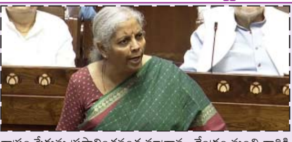
రాష్ట్రం పేరును ప్రస్తావించవసం మాత్రాన.. కేంద్రం నుంచి వారికి నిధులు వెళ్తా? వివక్షలది దారుణమైన ఆరోపణ. తమ రాష్ట్రాలకు ఏమీ ఇవ్వలేదన్న అభిప్రాయాన్ని ప్రజల్లో కల్పించాలని ప్రతిపక్షాలు ఉద్దేశపూర్వకంగా ఇలాంటి కుట్రలు చేస్తున్నాయి" అని నిర్మలమ్మ దుయ్యబట్టారు. ఆమె సమాధానంపై వివక్షలు అసంతృప్తి వ్యక్తంచేశాయి. ప్రభుత్వానికి వ్యతిరేకంగా నినాదాలు చేస్తూ సభ నుంచి వాకౌట్ చేశాయి. ఈ సందర్భంగా రాజ్యసభలో ప్రతిపక్ష నేత మల్లికార్జున్ ఖర్గే మాట్లాడుతూ.. "బడ్జెట్ లో రాష్ట్రాల మద్యం సమతుల్యత లేకపోతే అభివృద్ధి ఎలా సాధ్యమవుతుంది? దీన్ని మేం తీవ్రంగా ఖండిస్తున్నాం. దీనిపై నిరసన తెలియజేస్తాం" అని అన్నారు. ఇక, సమావేశాల ప్రారంభానికి ముందు పార్లమెంట్ ప్రాంగణంలో ఇండియా కూటమి నేతలు బడ్జెట్ కు వ్యతిరేకంగా ఆందోళన చేపట్టారు. సమాజ్ వాదీ పార్టీ అధ్యక్షుడు, ఎంపీ అభిలేష్ యాదవ్ మాట్లాడుతూ.. "రైతులకు కనీస మద్దతు ధరపై చట్టబద్ధత కల్పించాలని ఎంతోకాలంగా డిమాండ్ చేస్తున్నాం. కానీ, ఈ బడ్జెట్ లో కేంద్రం తమ మిత్రవర్గాలకు మాత్రమే 'మద్దతు ధర' ఇచ్చింది" అంటూ వ్యంగ్యాస్త్రాలు గుప్పించారు.

దిల్లీ: ఆర్థికమంత్రి నిర్మలా సీతారామన్ ప్రవేశపెట్టిన బడ్జెట్ లో... వివక్ష పార్టీలు పాలించే రాష్ట్రాలపై వివక్ష చూపారని ఇండియా కూటమి ద్వేషిస్తుంది. ఎన్నియే ప్రభుత్వం వైఖరికి వ్యతిరేకంగా పార్లమెంటు లోపలా, వెలుపలా నిరసన వ్యక్తం చేసింది. అయితే, ఈ ఆరోపణలపై ఆర్థిక మంత్రి నిర్మలా సీతారామన్ దీటుగా స్పందించారు. బుద్ధవారం రాజ్యసభలో ప్రసంగించిన ఆమె.. బడ్జెట్ ప్రసంగంలోనే అన్ని రాష్ట్రాల పేర్లను చెప్పలేమంటూ వివక్షలను దుయ్యబట్టారు. "కేంద్రం ప్రవేశపెట్టే ప్రతి బడ్జెట్ లో దేశంలోని అన్ని రాష్ట్రాల పేర్లను ప్రస్తావించే అవకాశం రాదు. మహారాష్ట్రలోని వందవనోల్ పోర్ట్ ను ఏర్పాటుచేయాలని కేబినెట్ నిర్ణయం తీసుకుంది. కానీ, నిస్సర్ది బడ్జెట్ లో మహారాష్ట్ర పేరును చెప్పలేదు. అలాగే.. తమను విస్మరించారని ఆ రాష్ట్రం భావిస్తోందా? బడ్జెట్ ప్రసంగంలో ఓ