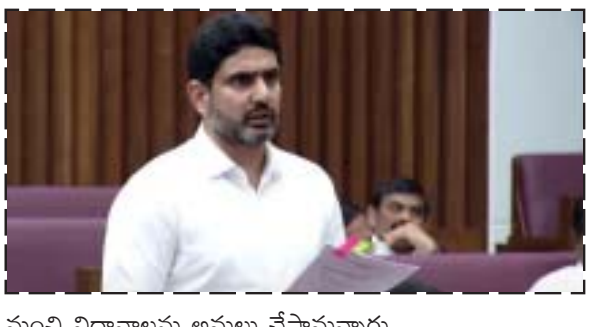
మంచి విధానాలను అమలు చేస్తామన్నారు.

అమరావతి: 'తల్లికి వందనం' పథకానికి విధివిధానాలను రూపొందిస్తున్నామని ఏపీ విద్యాశాఖ మంత్రి నారా లోకేశ్ తెలిపారు. శాసన మండలిలో సభ్యులు అడిగిన పలు ప్రశ్నలకు ఆయన సమాధానమిచ్చారు. ఎంతమంది పిల్లలు ఉన్నా అందరికీ 'తల్లికి వందనం' ఇస్తామని స్పష్టం చేశారు. ప్రభుత్వం ప్రైవేటు బడుల విద్యార్థులందరికీ ఈ పథకాన్ని వర్తింపజేస్తామన్నారు. గత ప్రభుత్వ వైఫల్యంతో ప్రభుత్వ పాఠశాలల్లో 72వేల మంది విద్యార్థులు తగ్గరని చెప్పారు. ఇతర రాష్ట్రాల్లోని మంచి విధానాలపై అధ్యయనం చేస్తామని తెలిపారు. వచ్చే విద్యాసంవత్సరం నుంచి విద్యాశాఖలో