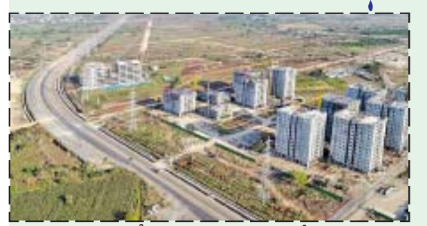
అమరావతి: ఏపీ రాజధాని ప్రాంతంలో నిలిచిపోయిన నిర్మాణాల స్థితిగతులపై అధ్యయనానికి రాష్ట్ర ప్రభుత్వం సాంకేతిక నిపుణులతో కమిటీని నియమించింది. ప్రజాలోగ్యశాఖ ఇంజనీర్

ఇన్ చీఫ్ వైరెన్ గా ఏర్పాటు చేసిన ఈ కమిటీలో సభ్యులుగా అరంజి, విజయవాడ మున్సిపల్ కార్పొరేషన్, ఏపీసీడీసీఎల్, ఏపీ సీఆర్డీయే, ఏడీసీ సంస్థలకు చెందిన చీఫ్ ఇంజనీర్లు, విజిటెన్స్ అండ్ ఎన్ ఫోర్స్ మెంట్ డైరెక్టరేట్ నుంచి ప్రతినిధిని కూడా కమిటీలో నియమిస్తూ ఉత్తర్వులు జారీ అయ్యాయి. రాజధాని ప్రాంతంలో చేపట్టి వేర్వేరు నిర్మాణాల్ని పరిశీలించాలని సాంకేతిక కమిటీకి ఆదేశాలు జారీ చేసింది. నిలిచిపోయిన నిర్మాణ పనులు ఎక్కడి నుంచి ప్రారంభించాలన్న అంశంపై కమిటీ సూచనలు చేయనుంది. వివిధ నిర్మాణాల పటిష్టత, స్థితిగతుల్ని పరిశీలించి నిఫార్సులు చేయనున్న కమిటీ.. రాజధాని అమరావతిలో రహదారుల విధ్వంసం, పైపైలెన్లు తడితర అంశాలను కూడా పరిశీలించనుంది.