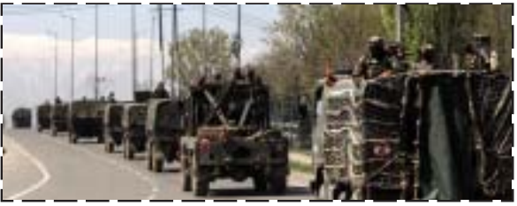
2025-26 మధ్యకాలంలో దాదాపు రూ. 4800కోట్లు ఖర్చు పెట్టాలని కేంద్ర ప్రభుత్వం గతంలో నిర్ణయించింది. ఈ క్రమంలో తాజా బడ్జెట్ లో రూ. 1050 కోట్లు కేటాయిస్తున్నట్లు కేంద్ర ఆర్థికమంత్రి నిర్మలా సీతారామన్ ప్రకటించారు. కీలకమైన సరిహద్దు గ్రామాల్లో ఉపాధి అవకాశాల విస్తరణకు 600 ప్రాజెక్టులను చేపడతామని కేంద్రం పేర్కొంది.

దిల్లీ: దేశ రక్షణలో సరిహద్దు గ్రామాలు ఎంతో కీలకంగా వ్యవహరిస్తాయి. అయితే, చౌరబాట్లు, అక్రమ రవాణాకు ఆస్కారమున్న ఆ ప్రాంతాల్లో అభివృద్ధి అంతంతమాత్రమే అని చెప్పవచ్చు. ముఖ్యంగా చైనా నుంచి ముప్పు పొందిన ప్రాంతాల్లో వేగ కేంద్ర ప్రభుత్వం వాటిపై దృష్టి సారించింది. డ్రాగన్ తో సరిహద్దు ఉన్న అరుణాచల్ ప్రదేశ్, సిక్కిం, ఉత్తరాఖండ్, హిమాచల్ ప్రదేశ్, లద్దాఖాల్ లోని వందల గ్రామాల్లో అభివృద్ధి కార్యక్రమాల కోసం తాజా బడ్జెట్ లో రూ. వెయ్యి కోట్లు కేటాయించింది. సరిహద్దు గ్రామాల సమగ్రాభివృద్ధి కోసం 'వైబ్రెంట్ విల్డెర్నెస్ ప్రోగ్రామ్' పేరుతో ఫిబ్రవరి 23, 2023న కేంద్ర ప్రభుత్వం ఓ పథకాన్ని ప్రవేశపెట్టింది. ఆ గ్రామాల ప్రజల జీవన ప్రమాణాలను పెంచడం, తద్వారా వలసలను తగ్గించే ఉద్దేశంతో కేంద్రపాఠశాలా శాఖ కార్యక్రమాన్ని చేపడుతోంది. ఇందులో భాగంగా 2022-23,