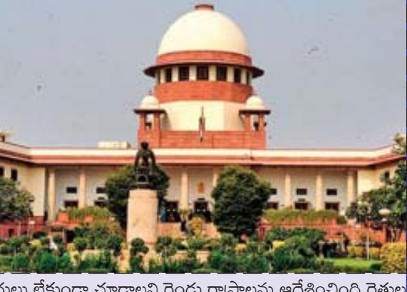
దులు లేకుండా చూడాలని రెండు రాష్ట్రాలను ఆదేశించింది. రైతుల ఉద్యమం సందర్భంగా హరియాణాలోని అంబాలాకు సమీపంలోని శంభూ సరిహద్దు వద్ద ఏర్పాటుచేసిన అడ్డుకట్టల్ని వారంతోగా తొలగించాలని ఇటీవల వంజాబ్-హరియాణా హైకోర్టు ఆదేశించింది. దీన్ని సవాల్ చేస్తూ హరియాణా ప్రభుత్వం సుప్రీంకోర్టును ఆశ్రయించింది. దీనిపై ఇటీవల విచారణ జరిపిన న్యాయస్థానం.. రాష్ట్ర ప్రభుత్వం తీరుపై అసహనం వ్యక్తం చేసింది. "హైవేను ఒక రాష్ట్రం ఎలా దిగ్వినియోగం చేస్తోంది? ట్రాఫిక్ ను నియంత్రించడం దాని బాధ్యత. జాతీయ రహదారిని తెరవండి.. కానీ, రాకపోకలను నియంత్రించండి" అని ధర్మాసనం ఆదేశించింది.

దిల్లీ: సమస్యల పరిష్కారం కోసం ఆందోళన చేస్తున్న రైతులకు, ప్రభుత్వానికి మధ్య విశ్వాసం లోపించినట్లు గమనించామని సుప్రీంకోర్టు వ్యాఖ్యానించింది. వారి డిమాండ్ల పరిష్కారం కోసం ప్రభుత్వాలు కొన్ని చర్యలు చేపట్టాలని అభిప్రాయపడింది. శంభూ సరిహద్దు పరిస్థితులపై హరియాణా ప్రభుత్వం దాఖలు చేసిన పిటిషన్ పై విచారణ సందర్భంగా సర్వోన్నత న్యాయస్థానం ఈ వ్యాఖ్యలు చేసింది. "రైతుల సమస్యలను తీర్చేందుకు మీరు (కేంద్ర ప్రభుత్వం) కొన్ని చర్యలు చేపట్టాలి. లేదంటే వారు దిల్లీకి ఎందుకు రావాలనుకుంటారు? ఇక్కడి నుంచి మీరు మంత్రులను పంపిస్తున్నారు సరే.. కానీ, మీపై వారికి విశ్వాసం లోపించినట్లు కన్పిస్తోంది. స్థానిక సమస్యలను విస్మరించి మీరు స్వప్రయోజనాల గురించి మాత్రమే చర్చిస్తున్నారని రైతులు భావిస్తున్నారు. ఇలాంటి పరిస్థితుల్లో అన్నదాతలు, ప్రభుత్వం మధ్య విశ్వాసం కలిగించే ఓ తటస్థ అంపైర్ కావాలి. అలాంటి వ్యక్తిని మీరు ఎందుకు పంపించట్లేదు?" అని ధర్మాసనం కేంద్రాన్ని ప్రశ్నించింది. రైతుల డిమాండ్ల పరిష్కారం కోసం ఓ స్వతంత్ర కమిటీని ఏర్పాటు చేయాలని సుప్రీం కోర్టు ప్రతిపాదించింది. ఈ కమిటీ సభ్యుల పేర్లను ఇవ్వాలని వంజాబ్, హరియాణా ప్రభుత్వాలను సూచించింది. దీనిపై వారు రోజుల్లోగా నిర్ణయం తీసుకోవాలని, అప్పటికే శంభూ సరిహద్దుల్లో యథాతథ స్థితిని కొనసాగించాలని తెలిపింది. సరిహద్దులోని భారీకేంద్రను తొలగించి ప్రజలకు ఇబ్బం