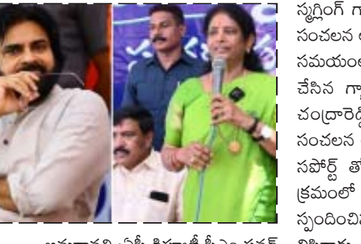
అమరావతి : ఏపీ డిప్యూటీ సీఎం పవన్ కళ్యాణ్ అడవులు పర్యావరణ, పంచాయతీరాజ్ శాఖల మంత్రిగా పాలనలో తన మార్పు చూపించేందుకు ప్రయత్నం చేస్తున్నారు. పరుస నమిక్షలతో శాఖల ప్రక్షాళనకు రంగంలోకి దిగారు. పలు కీలక నిర్ణయాలు తీసుకుంటూ పాలనలో పవర్ స్టార్ మార్పు చూపిస్తున్నారు. ఇందులో భాగంగా ఆయన ఆయన పరిధిలో ఉన్న శాఖలలో కీలక నిర్ణయాలు తీసుకుంటున్నారు. ఇక తాజాగా పవన్ కళ్యాణ్ ఎర్రచందనం స్పర్శింగ్ కట్టడి చేయాలని, ఎర్రచందనం స్పర్శింగ్ వెనుక ఉన్న పెద్ద తలకాయలను పట్టుకోవాలని అధికారులను ఆదేశించారు. శేషాచలామ్ అడవుల్లో ఎర్ర చందనం స్పర్శింగ్ వెనుక ఉన్న కింగ్ పిన్ లను అరెస్ట్ చేయాలన్నారు. ఇక అంతకుముందు వైసీపీ నేతలు పెద్ద రెడ్డి రామచంద్రారెడ్డి, మిథున్ రెడ్డి ఎర్రచందనం

రాహుల్ పవన్ కళ్యాణ్ కు వంగా గీత సవాల్ ప్రశ్నించారు. జీతం బకాయిలు ఎందుకు అతడి ఖాతాలో జమ చేయలేదని నిలదీశారు. " ప్రభుత్వం కేవలం ఇన్సూరెన్స్ మాత్రమే చెల్లించింది. ఎక్స్ గ్రేషియా ఇవ్వలేదు. ఈ రెండింటికీ తేడా ఉంది. అగ్నివీరుడి కుటుంబానికి ఇన్సూరెన్స్ కంపెనీలో చెల్లించాల్సిన తప్ప, ప్రభుత్వం ఇప్పించేది లేదు" అని రాహుల్ అన్నారు. దేశం కోసం ప్రాణాలు అర్పించిన అమరవీరుల కుటుంబాలను కేంద్రం గౌరవించి తీరాలని, కానీ ప్రధాని మోదీ మాత్రం.. వారిపై వివక్ష చూపుతున్నారని రాహుల్ విమర్శించారు. ఇది జాతీయ భద్రతకు సంబంధించిన అంశమన్న ఆయన.. కేంద్రం పొనుపాను సరే.. ఈ అంశాన్ని పదేపదే తీసుకురావడం ఉంటానని తెలిపారు. రక్షణ బలగాలను ఇండియా కూటమి ఎప్పటికీ బలహీన పరచబోదని స్పష్టం చేశారు.