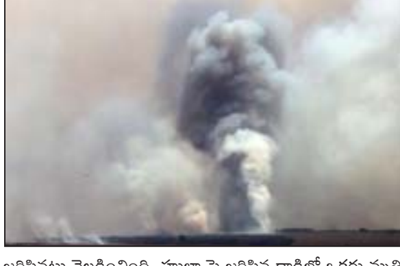
జరిపినట్లు వెల్లడించింది. హూలా పై జరిపిన దాడిలో ఒకరు మృతి చెందినట్లు లెటనాన్ వార్తా సంస్థ వెల్లడించింది.