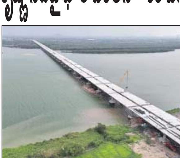
విజయవాడ : విజయవాడలో ట్రాఫిక్ ను నియంత్రించేందుకు విజయవాడ పశ్చిమ బైపాస్ రోడ్డు నిర్మాణం శర వేగంగా సాగుతోంది. చిన్న అవుట్ పట్టి నుంచి సూర్యపాలెం వరకూ

జరుగుతున్న పనులు తుది దశకు చేరుకున్నాయి. వెంకటపాలెం-కాజు మధ్య రోడ్డు నిర్మాణం పూర్తికావడం. సూర్యపాలెం వద్ద కృష్ణానదిపై భారీ వంతెనను నిర్మిస్తున్నారు. ఎన్ హెచ్ 6బి అడ్డంకులో నిర్మిస్తున్న సుమారు 3 కిలోమీటర్ల పొడవైన ఈ వంతెన చూపరులను ఆకట్టుకుంటోంది. ఈ బైపాస్ పనులు పూర్తయితే విజయవాడలో ట్రాఫిక్ రద్దీ తగ్గనుంది. హైదరాబాద్, విలూరుల నుంచి గుంటూరు వైపు వచ్చే వాహనాలు విజయవాడ నగరంలోకి రాకుండా గొల్లపూడి మీదుగా కాజు వద్ద చెన్నై వైపు వేరుకోవచ్చు. ఆయా నగరాల నుంచి తొందరగా రాజధాని అమరావతికి కూడా రాకపోకలు సాగించవచ్చు. చెన్నై హోదా జాతీయ రహదారిపై విజయవాడ నడిబద్దు మీదుగా రోజూ వేలాది లారీలు, ట్రక్కులు, భారీ వాహనాలతో విపరీతమైన ట్రాఫిక్ సమస్య ఏర్పడుతోంది. దీంతో సమస్యని తగ్గించేందుకు గుంటూరు జిల్లా కాజు, రాజధాని ప్రాంతం మీదుగా గొల్లపూడి నుంచి విజయవాడ శివారు చిన అవుట్ పట్టి వరకూ బైపాస్ రోడ్డు నిర్మాణం చేపట్టారు.