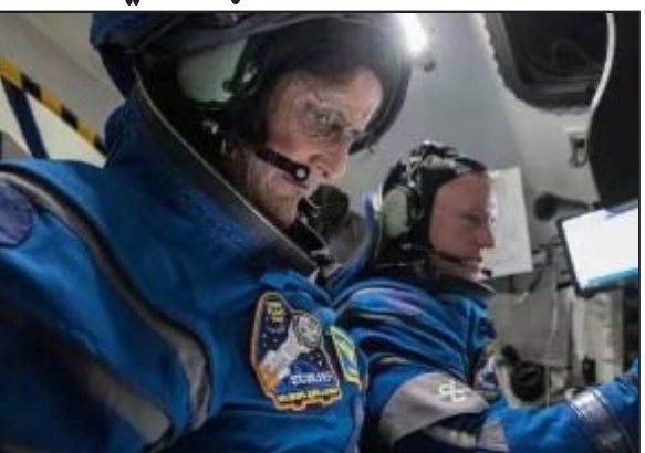
అవకాశం సైతం లేకుండాపోయినట్లు తెలుస్తోంది.

న్యూఢిల్లీ : బోయింగ్ సంస్థ స్టార్ లైన్ వ్యోమనౌకను రూపొందించింది. కాగా ఇది మానవహిత వ్యోమనౌక. జూన్ 5 ఈ వ్యోమ నౌక భారత సంతతికి చెందిన సునీత విలియమ్స్ తోపాటుగా బుష్ విల్డ్ ఫీల్డ్ అంతరిక్షానికి బయలుదేరింది. కాగా ఈ రోజున యాత్ర ముందుగా 8 రోజులు అనుకున్నారు. ఆనంతరం యాత్ర గడువును పది రోజులకు పెంచారు. అయితే ఆ తరువాత వ్యోమనౌకలో తల్లిత్తిన సాంకేతిక కారణాల దృష్ట్యా మూడు వారాలు గడుస్తున్నా నేటికీ వారు అంతరిక్షంలోనే ఉన్నారు.