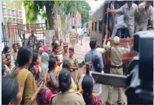
హైదరాబాద్ : గురుకులాల్లో ఉద్యోగాల భర్తీ గురుకుల అభ్యర్థులను పోలీసులు అరెస్టు చేసి వివిధ పోలీసు స్టేషన్లకు డిసెండ్రింగ్ ఆర్డర్ లో చేపట్టాలని గురుకుల తరఫింబారు. గురుకుల అభ్యర్థుల నిరసనకు మాజీ మంత్రి, ఎమ్మెల్యే

అభ్యర్థులు బుధవారం ఉదయం సీఎం రేవంత్ రెడ్డి నివాసంతో పాటు పెద్దమ్మ గుడి వద్ద భిక్షాటన చేసి నిరసన వ్యక్తం చేసిన సంగతి తెలిసింది. అక్కర్లుంది నాంపల్లిలోని గాంధీ భవన్ కు చేరుకున్నారు. డిసెండ్రింగ్ ఆర్డర్ లో ఉద్యోగాల భర్తీ చేపట్టి, తమకు న్యాయం చేయాలని గాంధీ భవన్ గేటు వద్ద నిరసనకు దిగారు. వి వాంట్ జస్టిస్ అంటూ ప్లకార్డులు ప్రదర్శించారు. గాంధీ భవన్ ను ముట్టడించి నిరసన వ్యక్తం చేస్తున్న హైదరాబాద్ : గురుకులాల్లో ఉద్యోగాల భర్తీ గురుకుల అభ్యర్థులను పోలీసులు అరెస్టు చేసి వివిధ పోలీసు స్టేషన్లకు డిసెండ్రింగ్ ఆర్డర్ లో చేపట్టాలని గురుకుల తరఫింబారు. గురుకుల అభ్యర్థుల నిరసనకు మాజీ మంత్రి, ఎమ్మెల్యే