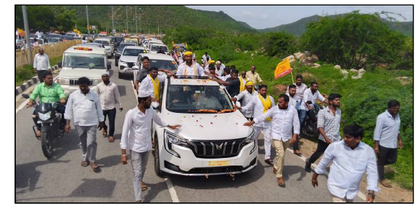
చేతులు ఊపుతూ ప్రయాణికులు తమ ఆనందం వ్యక్తం చేశారు. గువ్వలచెరువు ఫూల్ నుంచి రాయచోటి రింగ్ రోడ్డు వరకు భారీ సంఖ్యలో ప్రజలు మంత్రివర్యులను చూసేందుకు వాహనాలలో తరలివచ్చారు.

చెరువు, కొత్తరోడ్డు, నారాయణపురం, నీలకంఠరావుపేట, రామాపురం, గంగనేరు, కొండవాండ్లపల్లె, చిట్టూరు, బండపల్లె, బిట్ల కళాశాల, రింగ్ రోడ్డు, మీదుగా రాయచోటి పట్టణంలో భారీ ర్యాలీ ద్వారా మంత్రివర్యులు పార్టీ కార్యాలయం చేరుకున్నారు. రామాపురం ప్రజలు రెండు భారీ క్రీన్ ల ద్వారా గజమాలతో మంత్రివర్యులకు స్వాగతం పలికారు. అదేవిధంగా రోడ్డు కిరువైపులా ప్రజలు ఊరూరా నిలబడి బోకేలు, ఫూలమాలతో మంత్రికి స్వాగతం పలుకుగా ప్రతి ఒక్కరినీ మంత్రి చిరునవ్వుతో ప్రతి నమస్కారం చేస్తూ పేరుపేరునా పలకరిస్తూ ప్రజలకు అభివాదం చేశారు. గతంలో ఎన్నడూ ఎప్పుడూ చూడని విధంగా గువ్వల చెరువు ఫూలు నుంచి రాయచోటి టిడిపి కార్యాలయం వరకు ర్యాలీ ద్వారా ప్రజలు రావడంతో బస్సులో వెళ్లే ప్రయాణికులు ప్రజలకు, మంత్రివర్యులకు