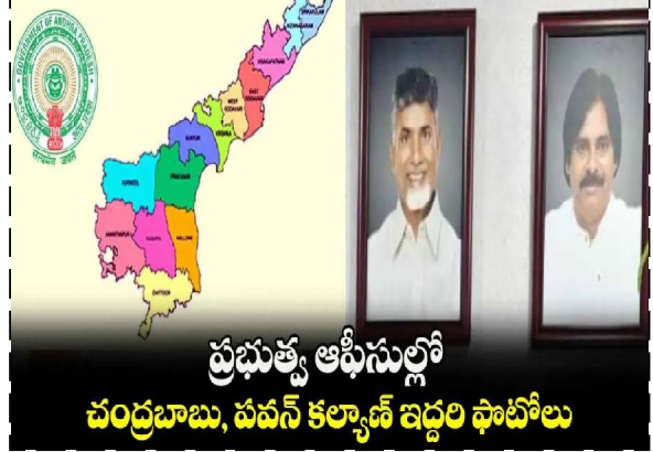
ప్రభుత్వ ఆఫీసుల్లో చంద్రబాబు, పవన్ కల్యాణ్ ఇద్దరి ఫోటోలు

అనందం వ్యక్తం చేస్తున్న పార్టీ శ్రేణులు అమరావతి : ఏపీలో అధికారంలోకి వచ్చిన డీజీపీ, జనసేన, బీజేపీ కూటమి ప్రభుత్వం.. మరో కీలక, సంచలన నిర్ణయం తీసుకున్నది. ప్రభుత్వ కార్యాలయాలు, ఆఫీసుల్లో సహజంగానే సీఎం ఫోటో ఉంటుంది. ఈసారి డీజీపీతోపాటు కూటమి ప్రభుత్వం ఉంది. జనసేన అధినేత పవన్ కల్యాణ్ డిప్యూటీ సీఎంగా ఉన్నారు. ఈ క్రమంలోనే సీఎం చంద్రబాబు తోపాటు డిప్యూటీ సీఎం పవన్ కల్యాణ్ ఫోటోలు పెట్టాలని ప్రభుత్వం నిర్ణయించింది. ఈ మేరకు అన్ని ప్రభుత్వ కార్యాలయాలకు ఆదేశాలు వెళ్లాయి. చంద్రబాబు, పవన్ కల్యాణ్ ఇద్దరి ఫోటోలు ఇక ప్రభుత్వ ఆఫీసుల్లో దర్శనం ఇవ్వనున్నాయి. ఈ మేరకు బి%ఎ%ఆర్ అధికారులు తక్షణమే చర్యలు చేపట్టాలని సీఎం చంద్రబాబు సూచించారు. చంద్రబాబు పవన్ కల్యాణ్ కు తనతో సమానంగా హెూడా ఇవ్వడం పట్ల అభిమానులు, జనసైనికులు హర్షం వ్యక్తం చేస్తున్నారు. ప్రమాణ స్వీకారానికి ముందు నుండి పవన్ కల్యాణ్ పదవి ఏదైనా కానీ