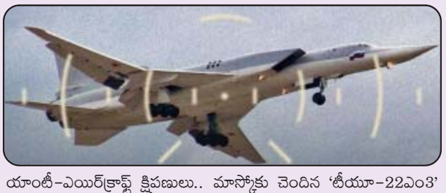
యాంటీ-ఎయిర్ క్రాఫ్ట్ క్షిపణులు.. మాస్కోకు చెందిన 'టీయా-22ఎం3'

కివ్: భారీస్థాయి దాడులతో ఉక్రెయిన్ పై రష్యా కొంతకాలంగా దూకుడు పెంచింది. మరోవైపు ఆయుధాల కొరతతో కివ్ సతమతమవుతోంది. ఈ పరిణామాల నడుమ ఉక్రెయిన్ కీలక ప్రకటన చేసింది. సైనిక చర్య మొదలైన తర్వాత మొట్టమొదటిసారి శత్రుదేశానికి చెందిన ఓ దీర్ఘశ్రేణి ప్యూజిల్ తో బాంబర్ను కూల్చివేసినట్లు వెల్లడించినది ఓ వార్తా సంస్థ తెలిపింది. పుతిన ప్రభుత్వం మాత్రం దీన్ని ఖండించింది. సాంకేతికతతోపాటుగానే అది స్ట్రాటోసోఫ్లోని నిర్మాణవ్య ప్రాంతంలో కూలిపోయిందని తెలిపింది. "గగనతల నిఘా వ్యవస్థ సహకారంతో