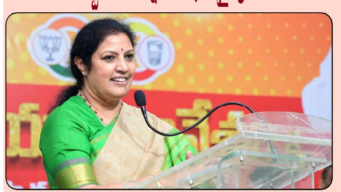
అమరావతి: దేవదాయశాఖ సిబ్బందికి ఎన్నికల విధులు అప్పగిస్తే .